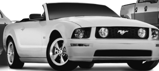
FORD MUSTANG CABRIOLET