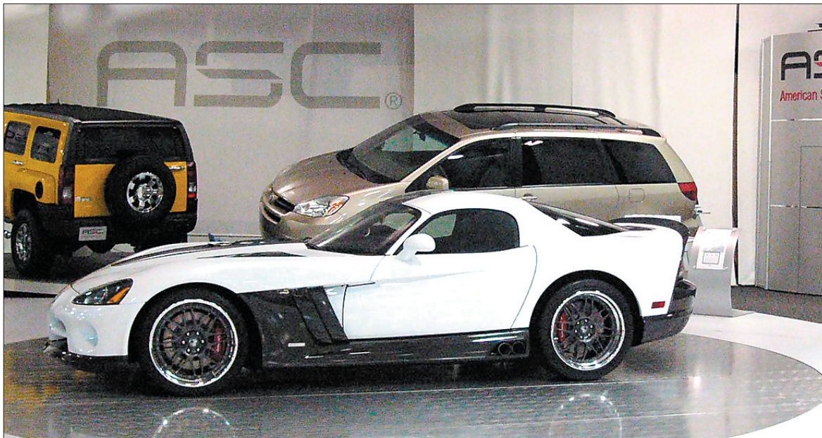
Dodge pourrait bien produire une version limitée de ce prototype Diamondback vu au stand ASC à Detroit en janvier dernier.

Selon ASC, le moteur produisait à cette époque 615 chevaux.