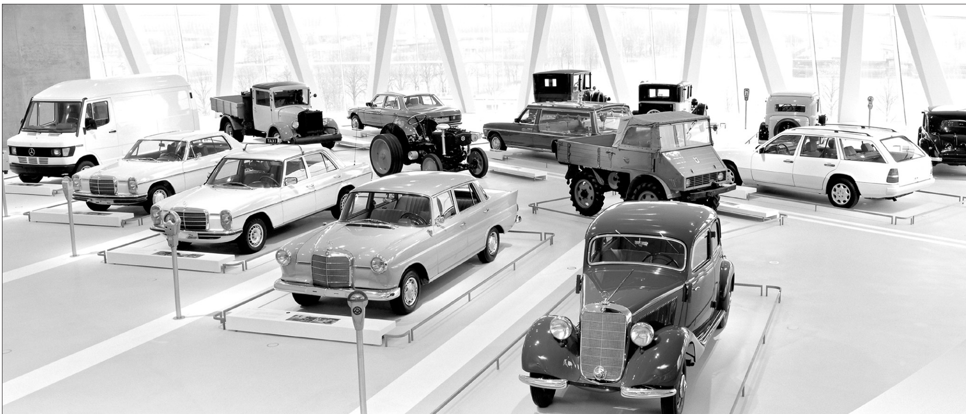
Cent vingt ans d'histoire automobile vous attendent à Stuttgart-Untertürkheim, dans le tout nouveau musée Mercedes-Benz.