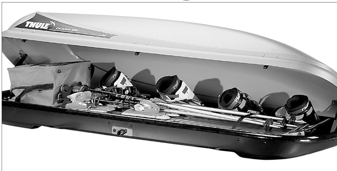
Une boîte de type intermédiaire permet de loger beaucoup d'objets, été comme hiver.