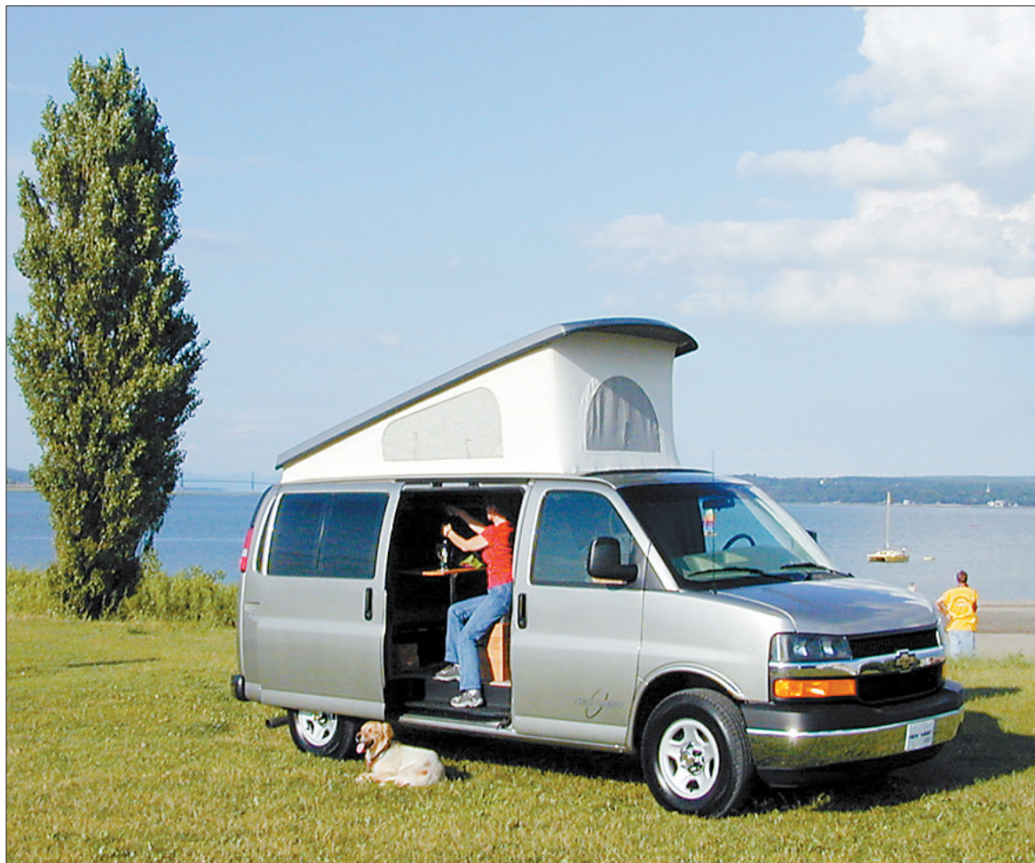
Porte latérale, toit extensible, bloc cuisine, dînette, lit, garde-robe, rangements, toilette portative: voici le New-West, une création québécoise qui roule sa bosse depuis quelques années déjà.

bloc cuisine, dînette, lit, garde-robe, rangements, toilette portative: voici le New-West, une création québécoise qui roule sa bosse depuis quelques années déjà.