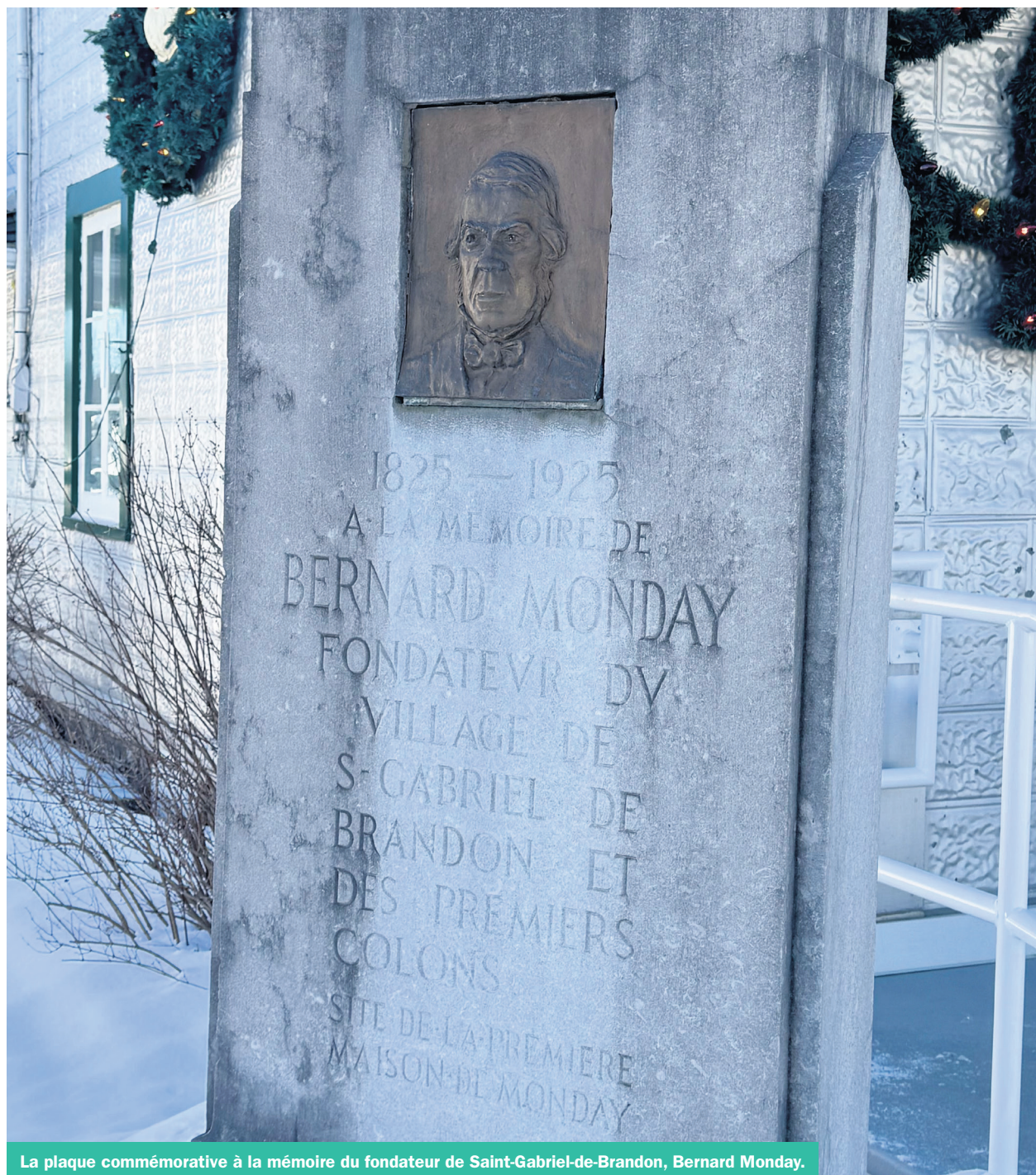
La plaque commémorative à la mémoire du fondateur de Saint-Gabriel-de-Brandon, Bernard Monday.