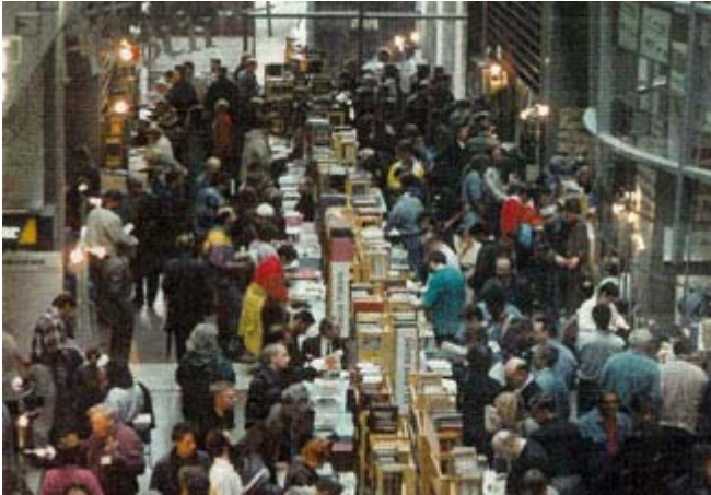
Foire de livres à Montréal

L'industrie du livre est en profonde mutation et alors que le ventes en librairie atteignent un pourcentage de 38% des ventes totales en 2006 aux États-Unis, celles sur Internet ont augmentées à 13%, sur un marché annuel de 28,5 milliards $ au total. (Source: US Census Bureau).