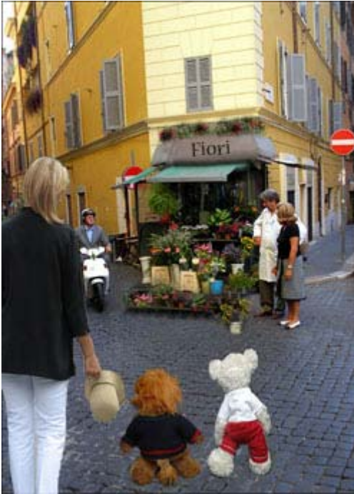
mademoiselle X et les deux mascottes, Monsieur X et sa soeur Miss Gym en visite de Pâques à Rome.

«Faire partie de la bonne société est une corvée. Ne pas en faire partie est une tragédie! (Oscar Wilde)