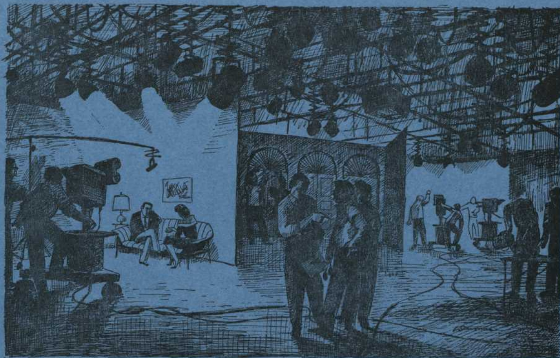
Rekvisit in Studio "D", CFQM-TV and CKMI-TV, Québec