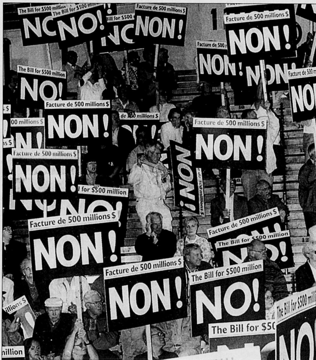
Non! Non! Assez c'est assez! Enough is enough! Plus de 5000 contribuables en furie ont participé hier au «rallye du non» convoqué par les maires des villes de la banlieue de Montréal en réaction à la facture de 500 millions présentée par Québec. Dans cette mer de pancartes, c'était à s'y méprendre: manifestation contre le transfert des 500 millions ou retour à un référendum pas si lointain?