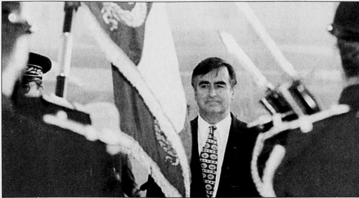
Le premier ministre Lucien Bouchard, hier, à son arrivée à Paris

Même s'il ne semble pas avoir d'inquiétudes à ce sujet, M. Bouchard a longuement insisté, hier, sur «la continuité» dans l'attitude de la France face