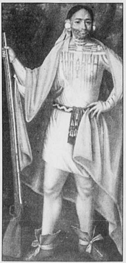
Sa Ga Yeath Qua Pieth Tow, chef Iroquois du XVIIIe siècle.