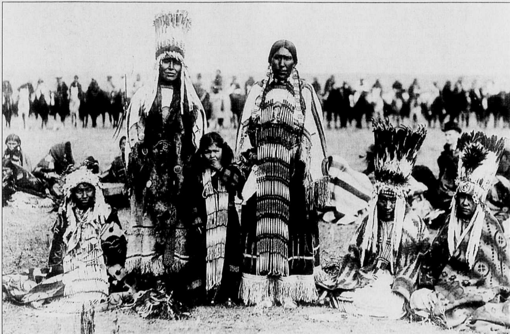
DES FEMMES ET DES ENFANTS PIEDS-NOIRS À SHAGANAPI POINT, PRÈS DE CALGARY, PHOTOGRAPHIÉS LORS DE LA VISITE ROYALE DE 1901.

A l'heure actuelle, les droits et les revendications des peuples autochtones suscitent une hostilité certaine chez une partie de l'opinion publique. Les arguments qu'ils invoquent et ceux que leur opposent les gouvernements canadien et québécois paraissent être fondés sur des prémisses diamétralement opposées. D'un côté, les autochtones soulignent qu'ils n'ont jamais été conquis et qu'ils n'ont pas renoncé à leur droit de se gouverner eux-mêmes; ils affirment avoir un droit à l'autodétermination tout aussi étendu que celui des Québécois. De l'autre, le gouvernement québécois a longtemps soutenu qu'à l'époque coloniale, les peuples autochtones avaient été privés de leurs droits territoriaux et qu'ils avaient été assujettis au droit du colonisateur. Ces deux thèses sont exactes mais correspondent à deux périodes différentes de l'histoire: la première s'étend de la fondation des colonies au milieu du XIX e siècle; la seconde débute à cette époque et se termine au début des années 70. En les replaçant dans leur contexte historique et juridique, il est possible de mieux saisir la complexité des enjeux actuels.