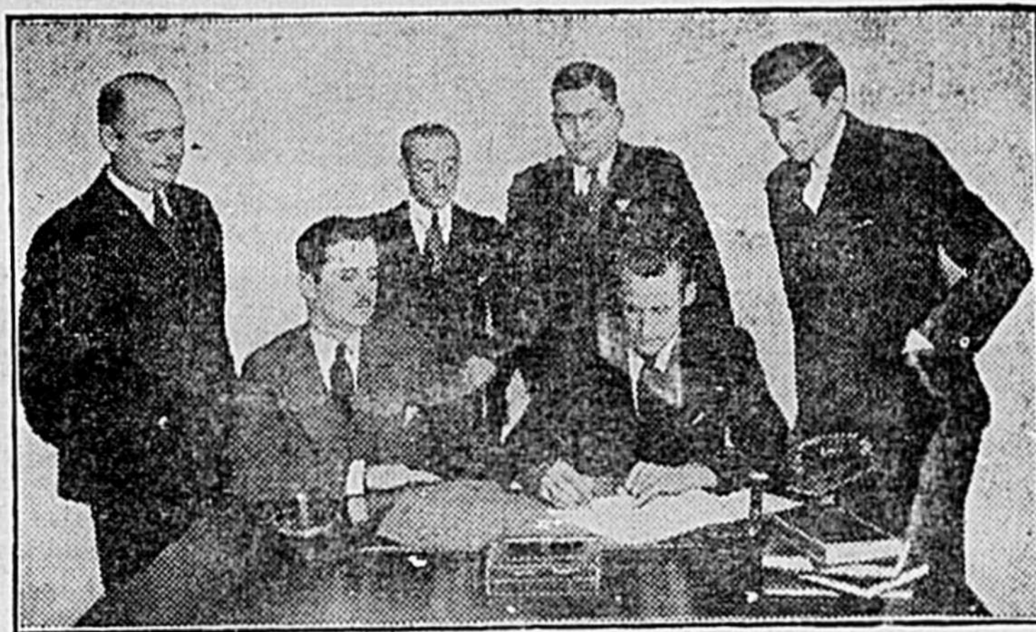
LE REPRÉSENTANT VI-TONE