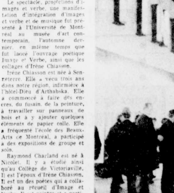
UN GROUPE d'employés de magasins de Victoriaville ont manifesté jeudi soir devant les établissements commerciaux qui étaient ouverts. Le groupe qui fut constamment surveillé par un détachement d'hommes de la sûreté municipale, a paradé devant les magasins ouverts en brandissant toutes sortes de pancartes. Sur ces cartes on pouvait lire des inscriptions du genre: "C'est un retour aux années 1900". "Ne profitons pas des aubaines du jeudi soir". "Pourquoi se donner tant de mal pour violer la loi", etc.

UN GROUPE d'employés de magasins de Victoriaville ont manifesté jeudi soir devant les établissements commerciaux qui étaient ouverts. Le groupe qui fut constamment surveillé par un détachement d'hommes de la sûreté municipale, a paradé devant les magasins ouverts