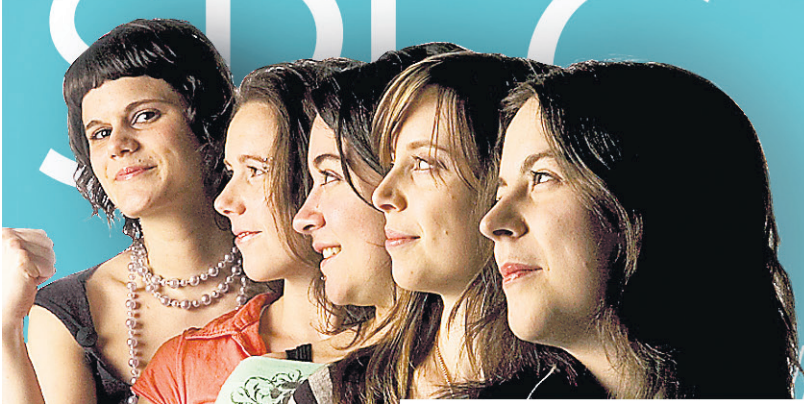
LES MOQUETTES COQUETTES