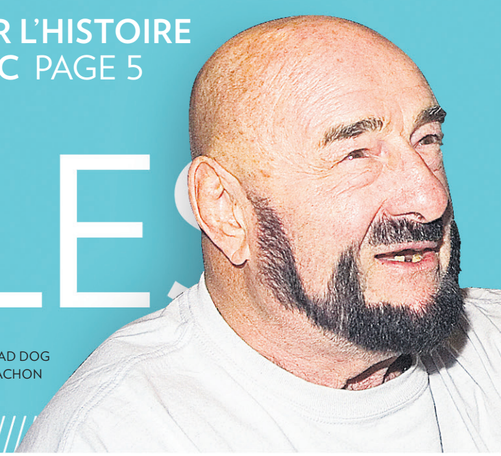
MAD DOG VACHON