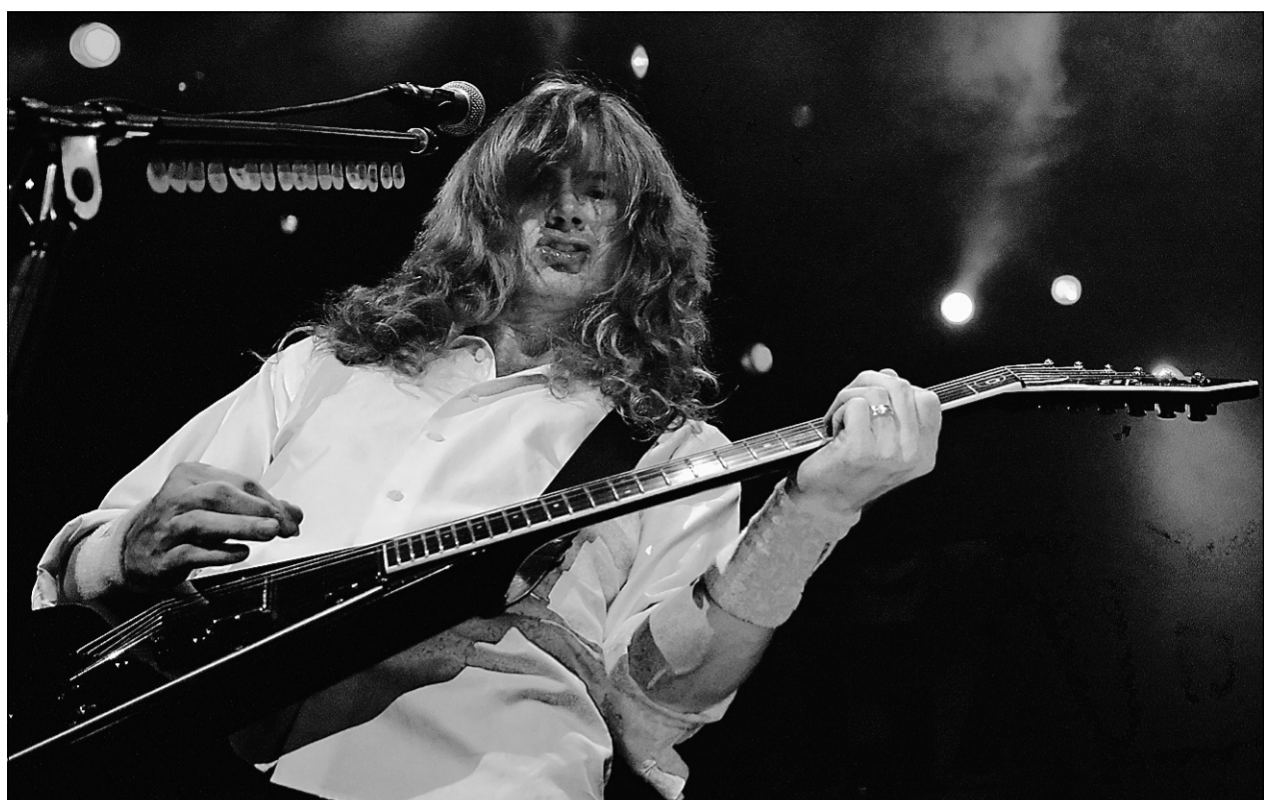
Le chanteur de Megadeth, Dave Mustaine.

Il était assez frappant de regarder cette foule, très jeune, s'adonner à des séances de air guitar, chanter à tue tête ou faire du slam