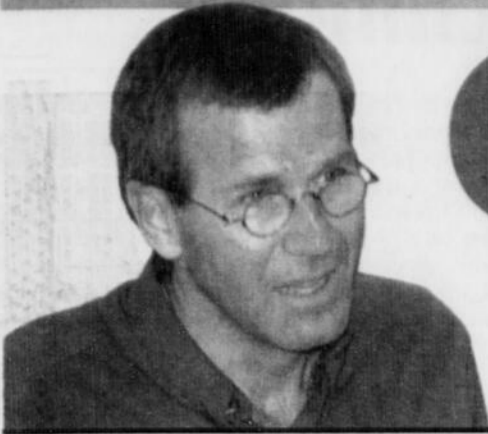
La Presse Guy Crevier annonce un contrat avec Transcontinental / Page B3