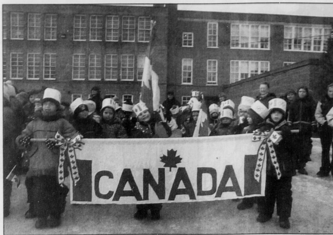
Même si les Jeux Olympiques de Salt Lake City sont choses du passé, la fièvre olympique se poursuit à Richmond, notamment à l'école primaire St-François qui tient plusieurs activités cette semaine sur ce thème. Hier c'était les cérémonies d'ouverture officielle des jeux.

Il ne s'agit pas d'une première à cette école, laquelle organise une telle activité à tous les quatre ans maintenant depuis les 20 dernières années. L'école fête cette année sa cinquième édition des Jeux Olympiques d'hiver et tous s'impliquent à fond dans ce projet scolaire.