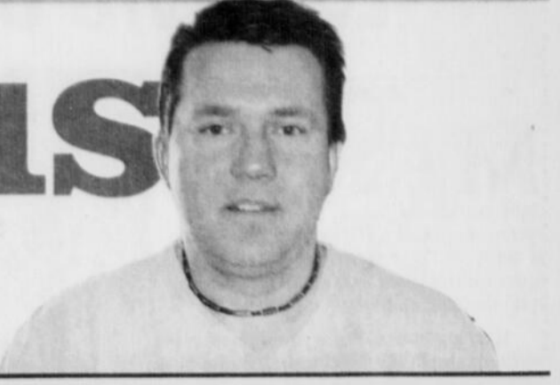
Toptech L'art de faire plus avec les mêmes ressources / Page B6