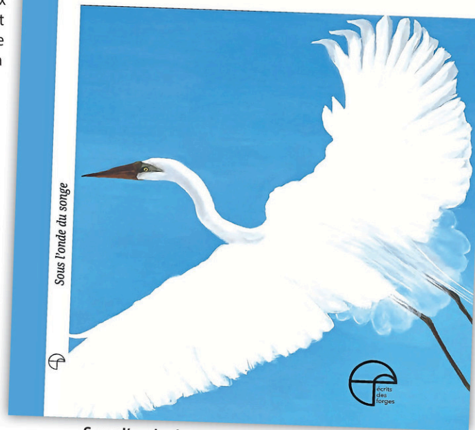
Sous l'onde du songe , de Pierre Chatillon.

Chatillon a d'ailleurs toujours aimé imaginer et créer des choses nouvelles, comme le parc littéraire l'Arbre des mots, lieu mythique situé tout près du Musée des cultures du monde. «Faire un parc, c'est de la poésie.»