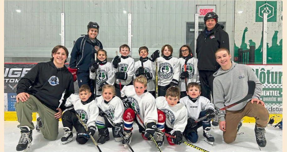
Une partie des jeunes ayant pris part à l'École de hockey Jean-Yves Doucet.