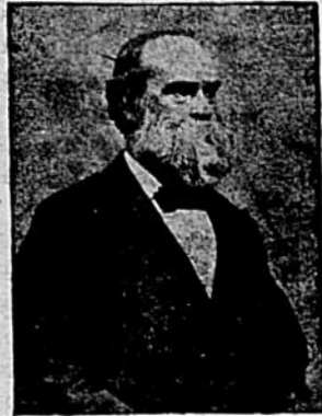
L'Hon. G. C. DESSAULLES, le doyen d'âge du Sénat canadien,

Notre éminent compatriote jouit encore d'une santé merveilleuse qui étonne tous ceux qui le connaissent, et, depuis qu'il siège à la Chambre Haute, il n'a pas manqué d'assister à l'ouverture des sessions non plus qu'à toutes les séances du sénat où se