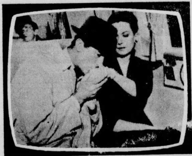
Les Grands Films, samedi le 21 avril, à 20 heures — Au lieu du hockey — "UN MATIN COMME LES AUTRES".