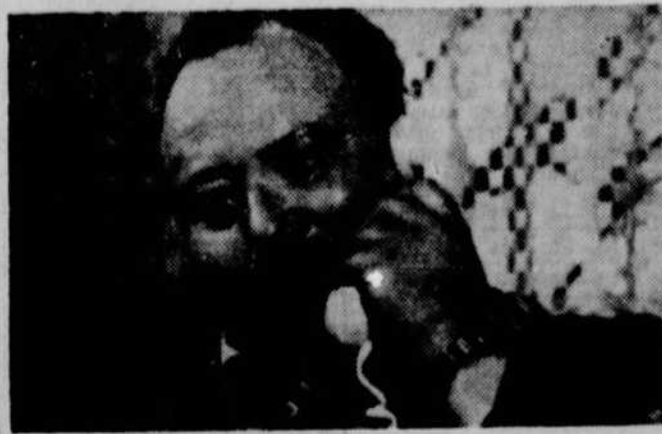
Témoignages, mercredi le 25, à 21 heures 30. Un texte de Carl Dubuc : "La Reconstitution".