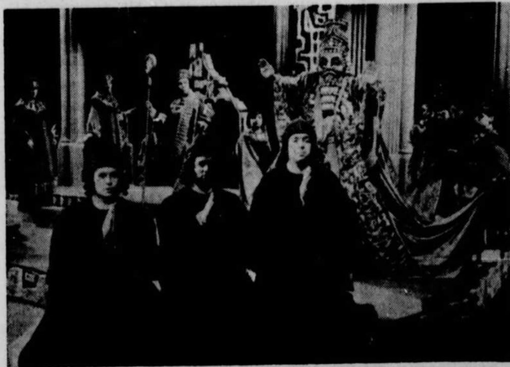
Les Beaux Dimanches, le 22, à 19 heures 30. Un drame lyrique d'une grande beauté "La Fournaise ardente" de Benjamin Britten : un "mystère" du Moyen-Age traité à la façon d'un Nô japonais.