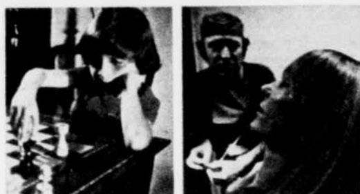
Avez-vous déjà rencontré des enfants surdoués? Leur pouvoir est presque inquiétant... Peut-être aurez-vous un jour recours à l'hypnose médicale.