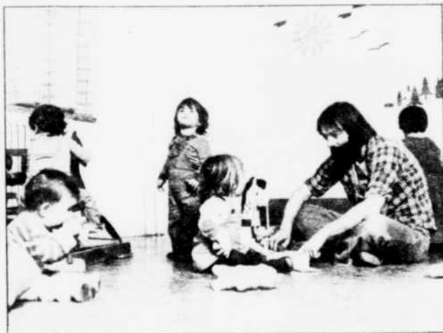
La centaine d'enfants de la garderie Soleil du quartier partage un étage de l'ancienne école Jacques-Marquette, à Montréal.

Voilà l'image de ce beau grand projet qui n'en est encore qu'à ses débuts mais qui, avec force et courage, pourra se targuer d'avoir démontré qu'il est possible d'aménager et de reprendre en main des écoles qu'on disait insalubres.