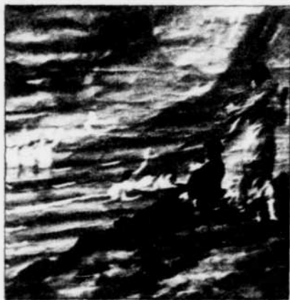
Le Rêve du poète (détail), allégorie peinte en 1898 par Charles Gill (11 pi sur 7 pi 2 po).