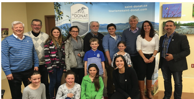
Le comité jeunesse