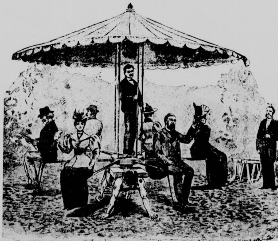
LES ATHLÈTES. — LE TOURNIQUET DE RASSO

La vraie grandeur se trouve dans le caractère, jamais dans les circonstances. La couronne ne la donne pas à celui qui n'en est pas digne. Elle n'est pas la compagne de la pourpre auprès du cœur qui n'est pas digne de la pourpre. Le trône même ne peut la donner qu'à condition que celui qui l'occupe ait un caractère royal, que l'on reconnaît aussi bien chez celui qui arrose la glèbe de ses sueurs, que chez l'homme qui tient les destinées d'un peuple dans sa main.