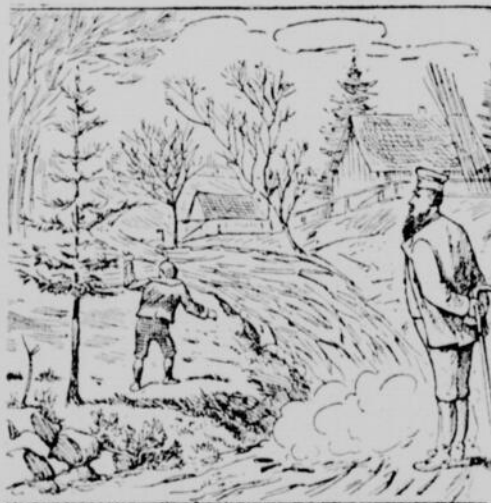
Qui est l'homme vert qui se en va ainsi avec une brassée de branches sèches ?

Nous commencerons, sous peu la publication d'un feuilleton qui plaira à toutes les familles.