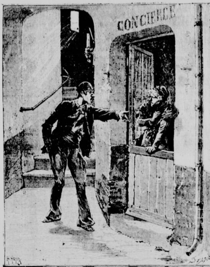
La Limace lui cria : " Hé ! va donc ! vieux trumeau. — Page 286, col. 2

— Le gosse ! on l'emmènera, s'il le faut... On y apprendra le métier de mendigo... Quand il ne rapportera pas sa journée, on lui tannera le cuir... On aura vite fait de le dresser.