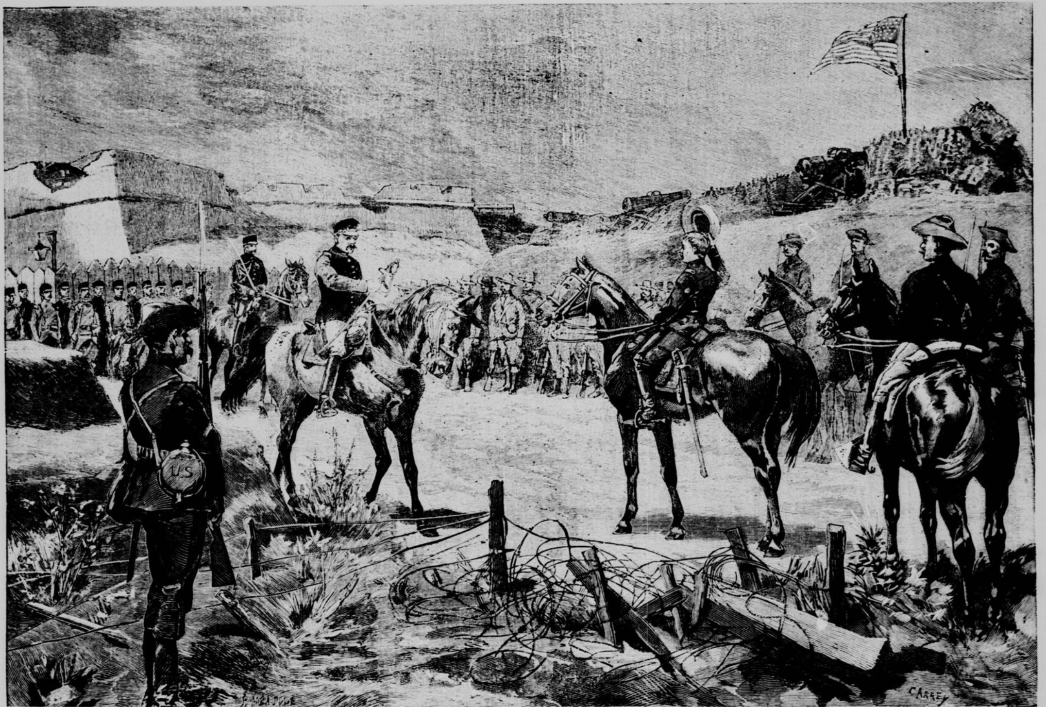
LA GUERRE HISPANO-AMERICAINE. — La reddition de Santiago