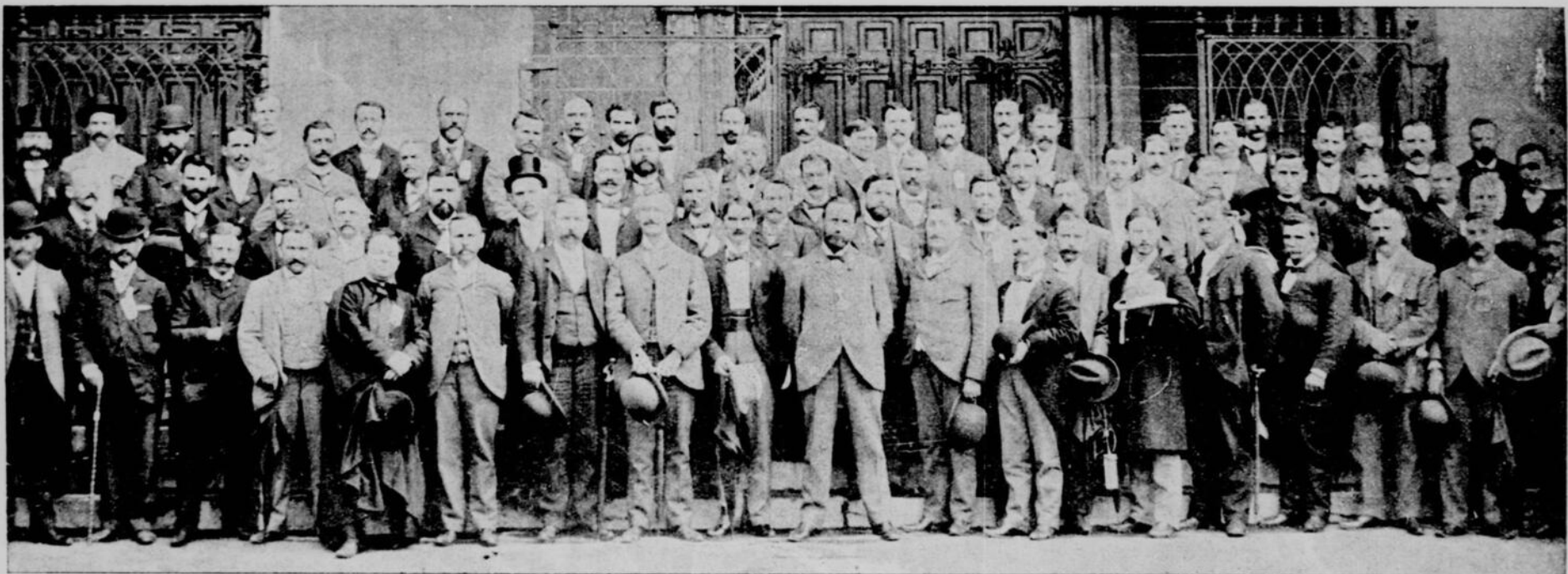
3065, Saint-Cunégonde