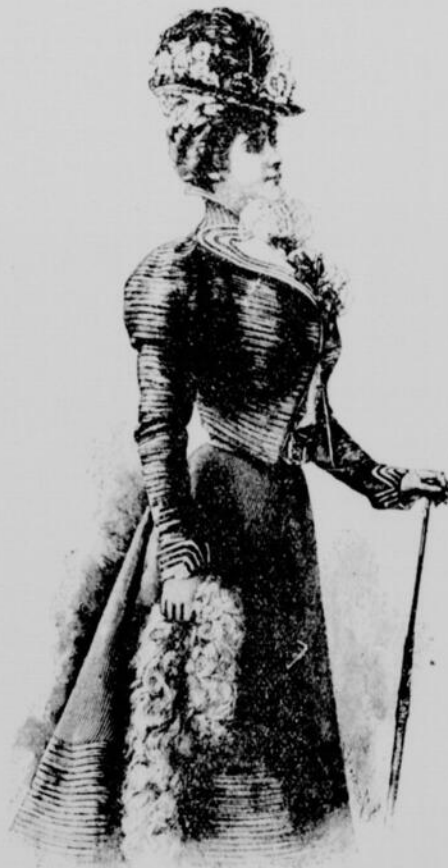
Toilette pour jeune femme ou jeune fille. Robe en serge bleu marin, ornée de tresses assorties, revers et parements en peau de soie ivoire rayée de velours comète noirs.

Les revers et les parements des manches sont en soie blanche rayés de velours comète noirs ou de rubans de satin. La jupe sera également garnie de galons ou plissée à plus lingerie à mi hauteur.