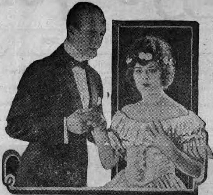
Félix devient de plus en plus amoureux