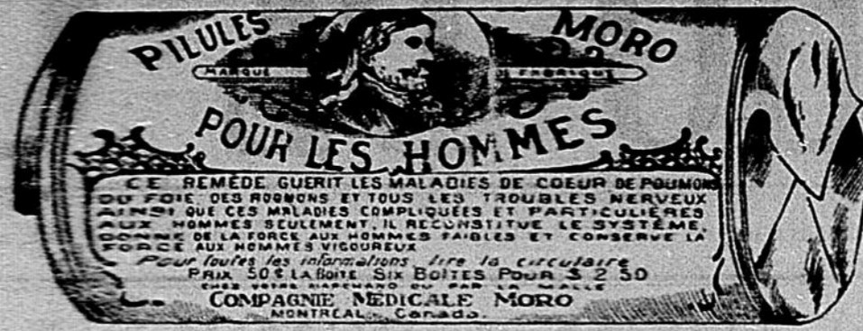
Re-Suile exact d'une boîte de Pilules Moro.

Donnez-nous un homme brisé par les excès, la dissipation, un travail trop dur, les tracas, ou par toute autre cause qui ait sapé sa vitalité, avec les Pilules Moro nous le rendrons aussi vigoureux en tous points, que n'importe quel homme de son âge.