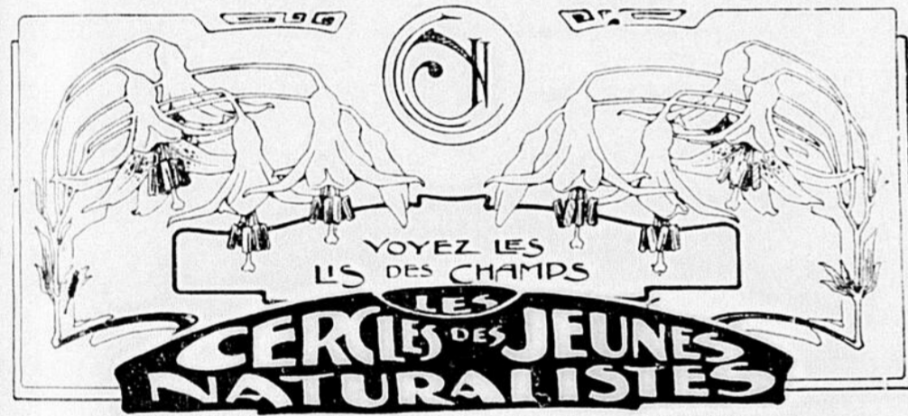
Alliés à la Soc. Can. d'Histoire Naturelle et reconnus d'utilité publique par le Gouvernement de la Province de Québec.