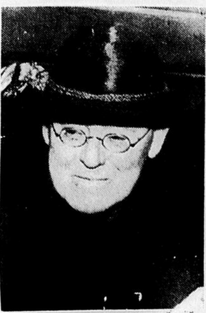
S. E. Mgr Arthur Hinsley, archevêque de Westminster, quitte sa résidence pour aller à Rome, recevoir son chapeau de Cardinal.