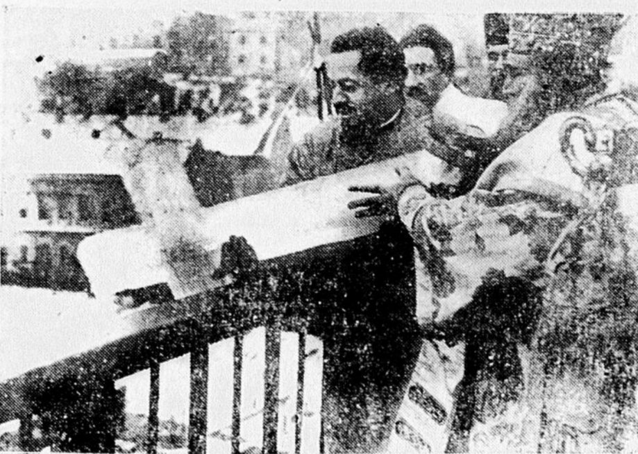
L'ÉPIPHANIE A BELGRADE. — donne lieu chaque année à une curieuse cérémonie : la patriarcale de Varna lance du pont Alexandre une croix de glace dans le Danube et des nageurs ont rivalisé de vitesse pour aller la recueillir.