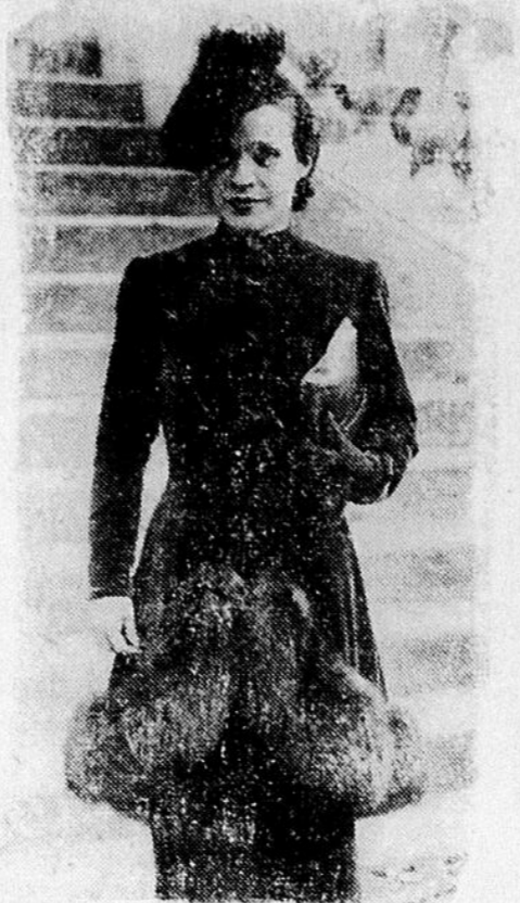
MODES D'HIVER EN FRANCE, un élégant manteau remarqué au pesage d'Auteuil.