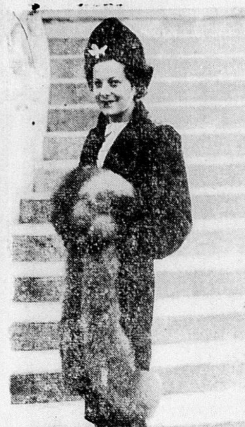
ET UN AUTRE TRES ELEGANT MANTEAU.