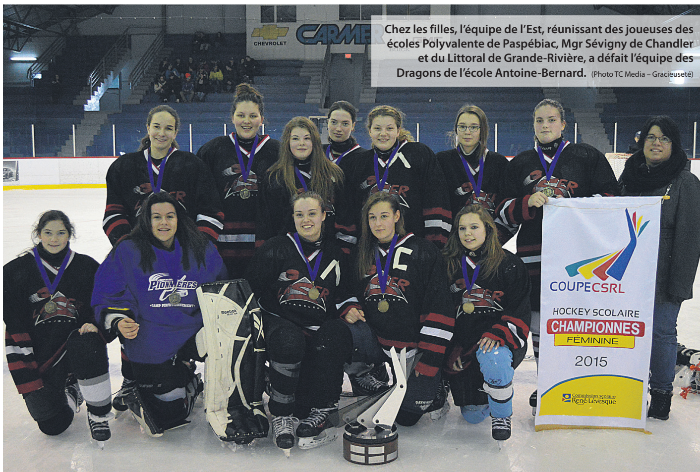
Chez les filles, l'équipe de l'Est, réunissant des joueuses des écoles Polyvalente de Paspébiac, Mgr Sévigny de Chandler et du Littoral de Grande-Rivière, a défait l'équipe des Dragons de l'école Antoine-Bernard.

Enfin, chez les « juvéniles », les Balbuzards de l'école aux Quatre-Vents de Bonaventure ont raflé les grands honneurs dans le match le plus excitant des deux jours de compétition. Ils ont obtenu une victoire à l'arrachée sur les Cougars de l'école Mgr Sévigny de Chandler en marquant le but gagnant avec 4 secondes à jouer à la grande finale. Le pointage final fut de 3 à 2