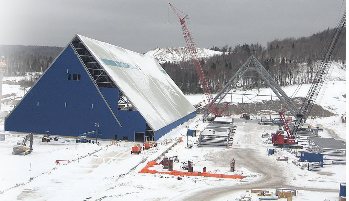
Les travaux qui s'amorceront ce printemps sont très importants pour Ciment McInnis.

Cette entente vise à former un sous-comité environnemental permanent qui discutera de trois enjeux comme la réduction des GES, le suivi des normes les plus exigeantes sur le plan environnemental (NESHAP-National Emission Standards for Hazardous Air Pollutants) que Ciment McInnis s'est engagé à respecter et le respect de ses engagements auprès de Pêches et Océans Canada (MPO) relatifs aux mammifères marins.