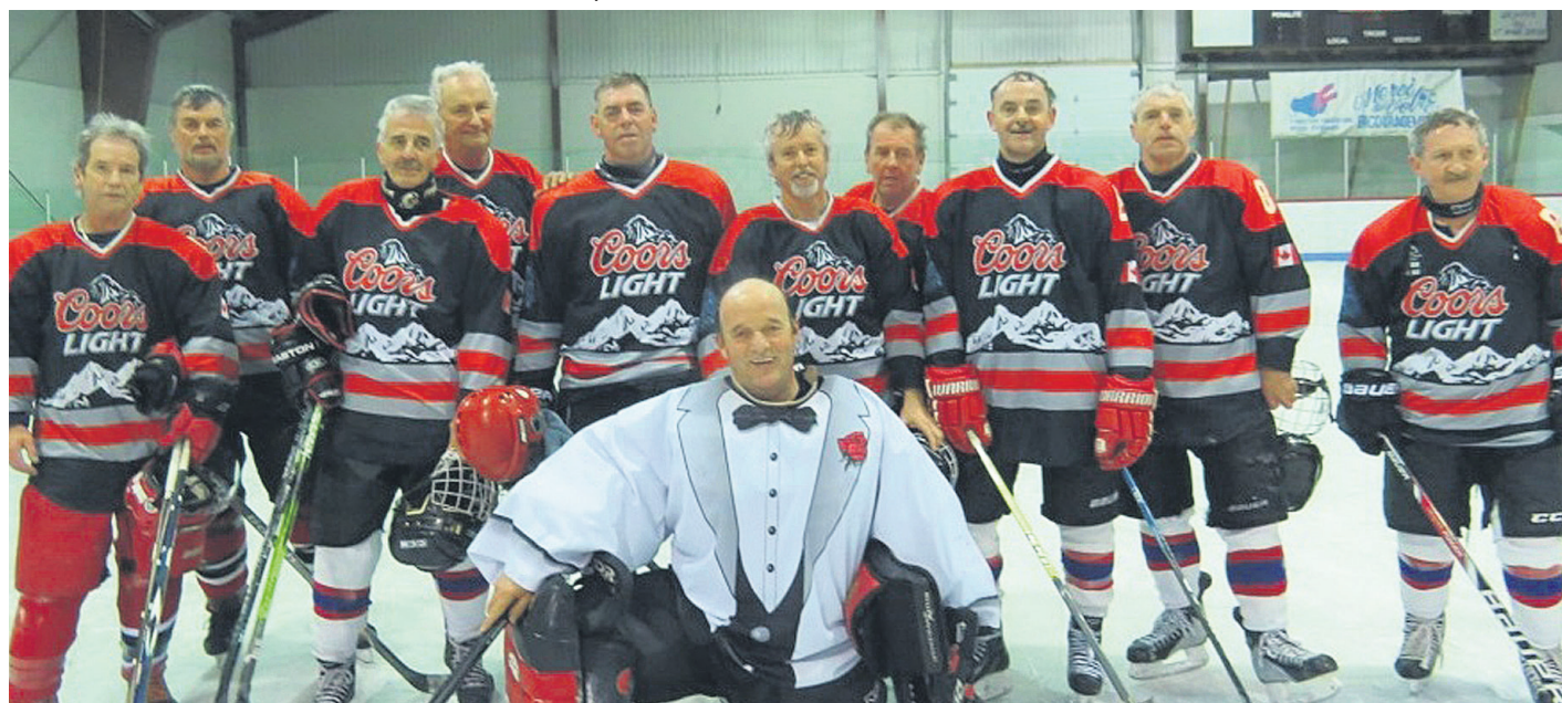
Dans la finale des 60 ans et plus, le C.R.C. de Chandler s'est avoué vaincu face au Dépanneur S.L. de Caplan par la marque de 6 à 4 où les beaux jeux se succédèrent tout au long de la partie.

« Au nom de tous les enfants malades qui ont réalisé leur rêve ou qui vont le réaliser, MERCI. Merci à nos commanditaires, aux bénévoles, à tous les joueurs et à la population. » (A.L.)