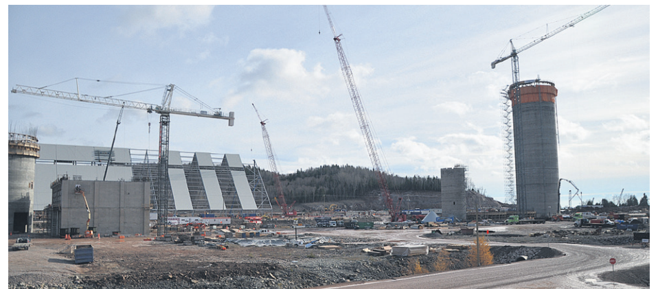
Ciment McInnis a conclu une entente visant la création d'un sous-comité environnemental.