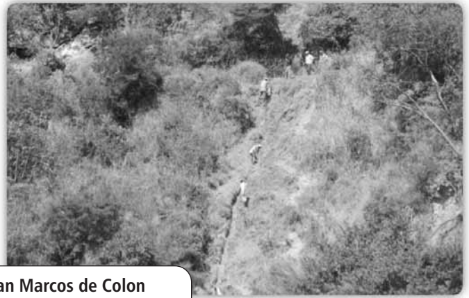
1. San Marcos de Colon 2 et 3. Creusage de la ligne d'approvisionnement d'eau