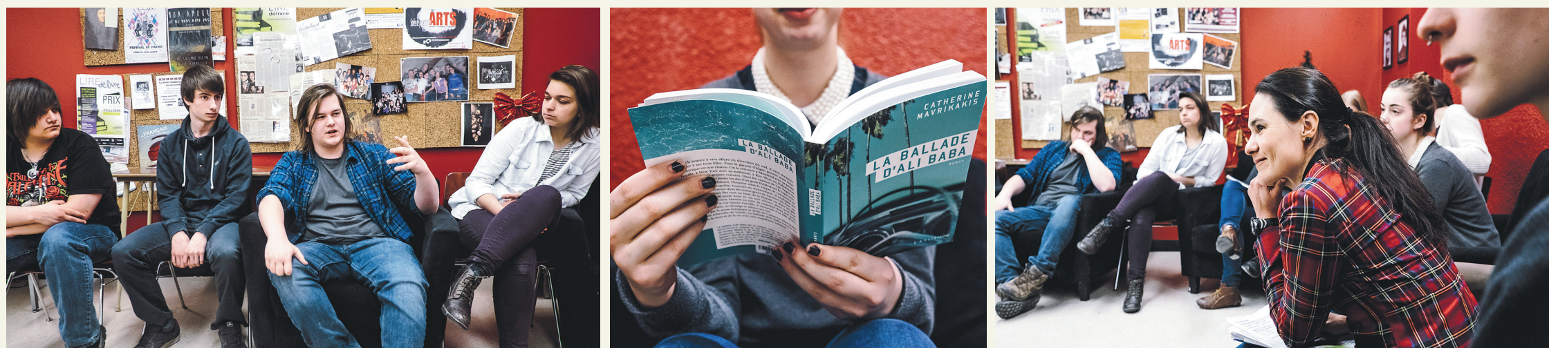
RENAUD PHILIPPE LE DEVOIR

Des étudiants du cégep de Lévis-Lauzon en pleine discussion pour le Prix littéraire des collégiens 2015