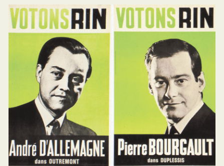
Affiche du RIN à l'élection provinciale de 1966