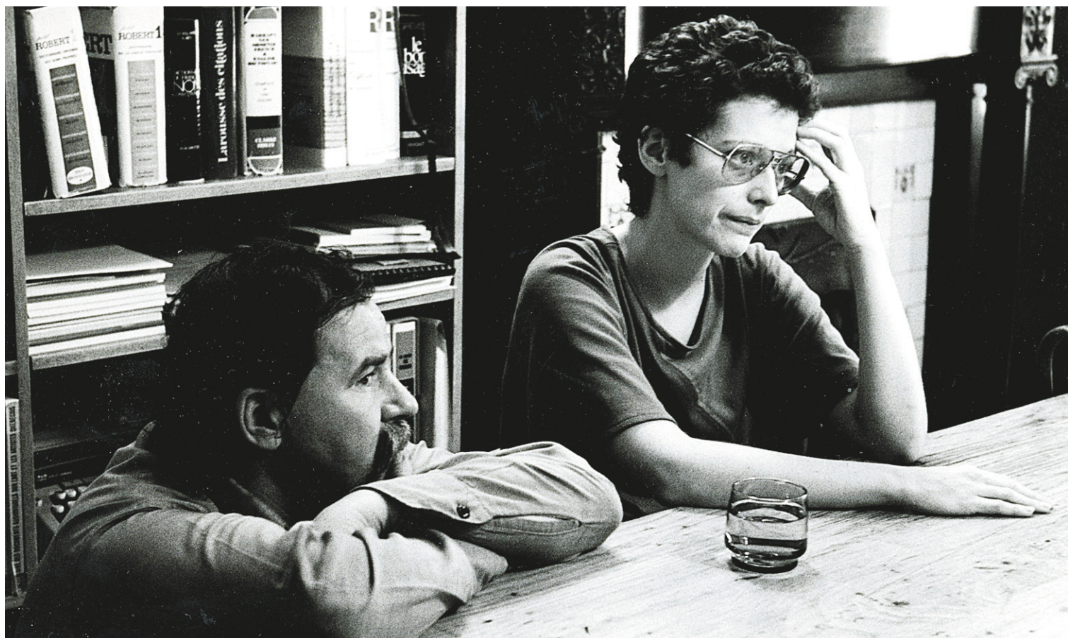
Le réalisateur Jean-Claude Labrecque et la poète Marie Uguay lors du tournage du film Marie Uguay (1982)

même cégep, autre cours —, nous devons tenir journal et le remettre au professeur à la fin de la session. Moi qui avais délaissé ce rituel depuis l'enfance, j'eus quelques hésitations à me livrer à un exercice que je trouvais désormais ardu, pour ne pas dire repugnant. Tenir journal demandait une certaine discipline et un don de soi que je n'arrivais plus à stimuler. Tout ce que j'écrivais était rationné en poèmes. Force est d'admettre que ce cahier n'y échappa guère. J'avais peur de son ombre, trop près de la mienne. En me refusant longtemps la forme du journal à l'âge adulte, j'écartai aussi celle que Marie Uguay, Sylvia Plath, Susan