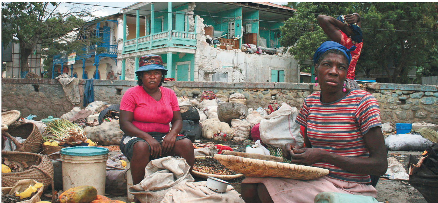
Scène de vie à Jacmel