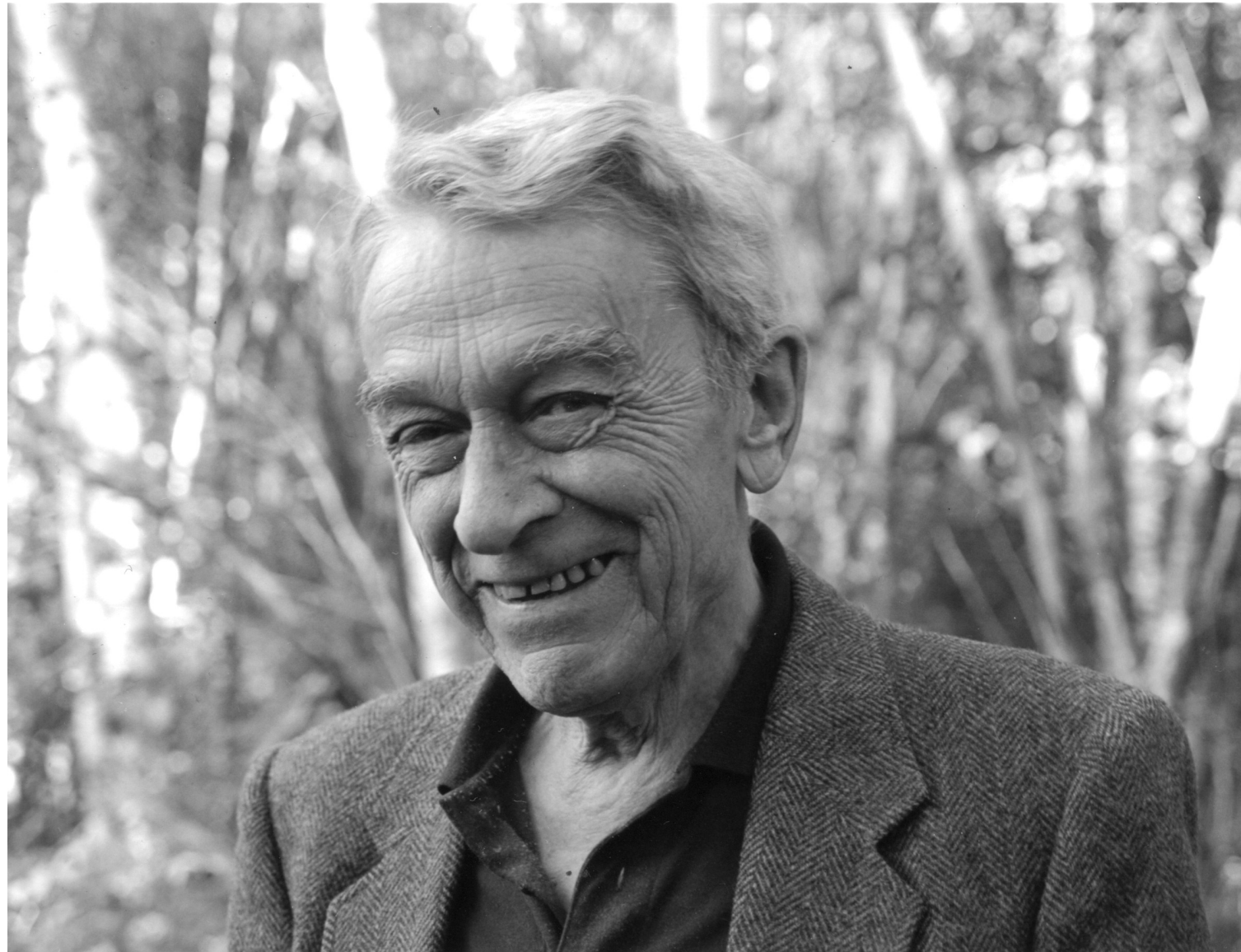
André Langevin en 1998, année où son œuvre, maintenant méconnue, est couronnée du prestigieux prix Athanase-David.

À 20 ans, dans Le Devoir , au sortir de la Deuxième Guerre mondiale, Langevin livre un plaidoyer pour une littérature porteuse d'espoir, capable de donner du sens à la vie. « Le rôle de l'écrivain moderne, suggère-t-il, est de trouver au laboureur sur sa terre une raison de travailler qui ne soit pas celle de se nourrir; aux peines de l'ouvrier une autre raison que celle de l'argent; à l'étudiant une autre raison à ses études que sa vie future à