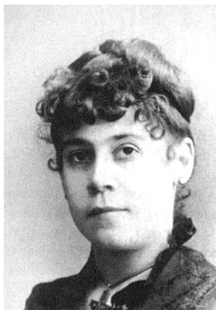
JAMES RICE BANQ

UNE HISTOIRE DE LA POLITESSE AU QUÉBEC NORMES ET DÉVIANCES, XVII e -XX e SIÈCLES Sous la direction de Laurent Turcot et Thierry Nootens Septentrion Québec, 2015, 344 pages