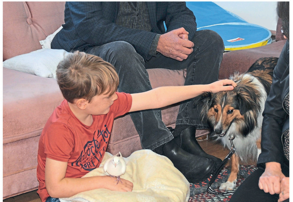
Ficelle en plein boulot.

La zoothérapie est utilisée dans plusieurs cas et est destinée aux gens de tout âge. Les