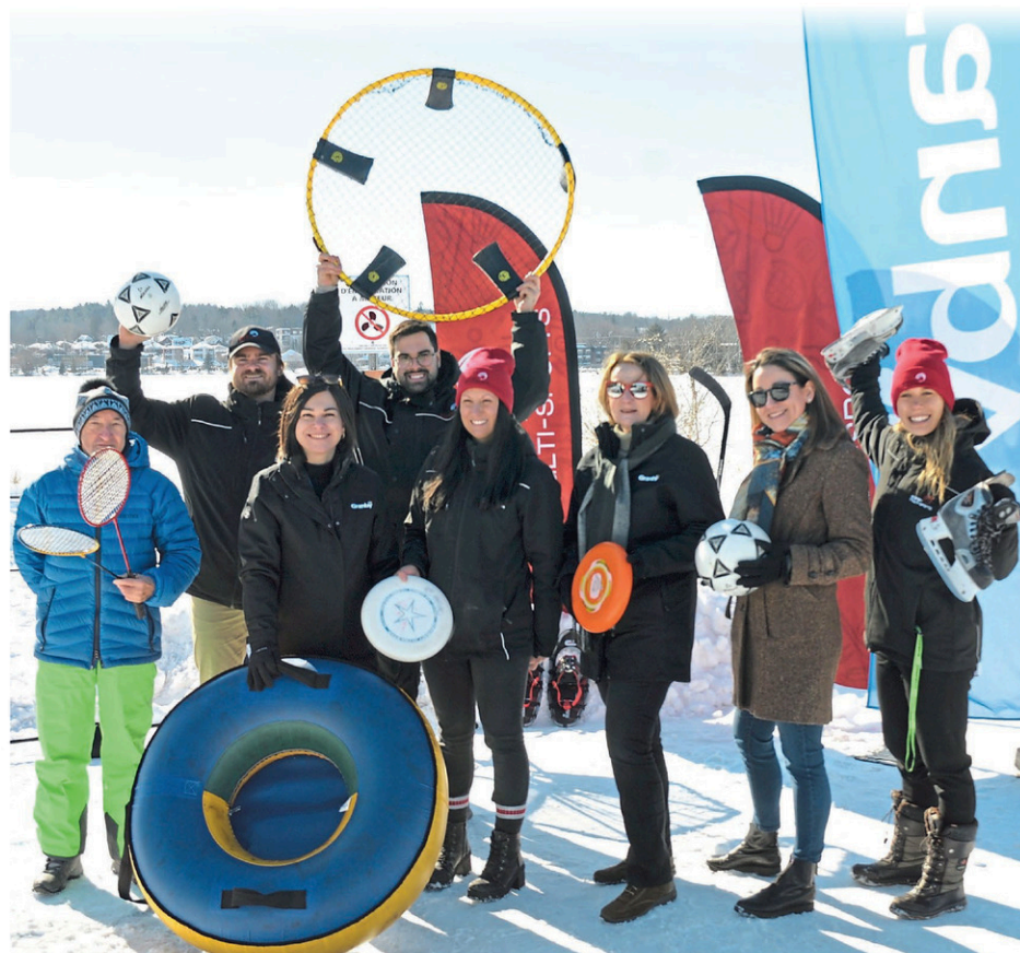
Des représentants municipaux et des membres de Granby Multi-Sports étaient présents au lancement de la première édition du Festival du sport d'hiver.

Les coupons de participation sont disponibles en s'inscrivant à l'événement (gratuitement) sur https://lepointdevente.com/billets/festivaldusportdhiver , en participant aux activités sur place et en répondant au sondage de satisfaction et en le publiant sur les réseaux sociaux.