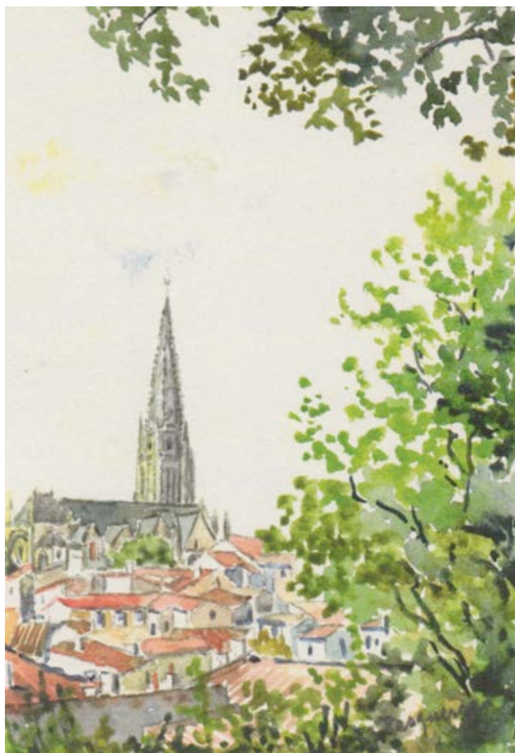
Église Notre-Dame, vue du parc Baron - Fontenay-Le-Comte Lieu de baptême de notre ancêtre Antoine Drapeau, le 11 janvier 1648 Aquarelle de Pierre Pasquereau, avec l'aimable autorisation de Léone Pasquereau