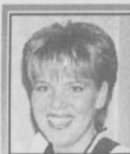
France Coiffeuse Tél.: 964-1245

545, boul. des Seigneurs - Terrebonne - 961-9551