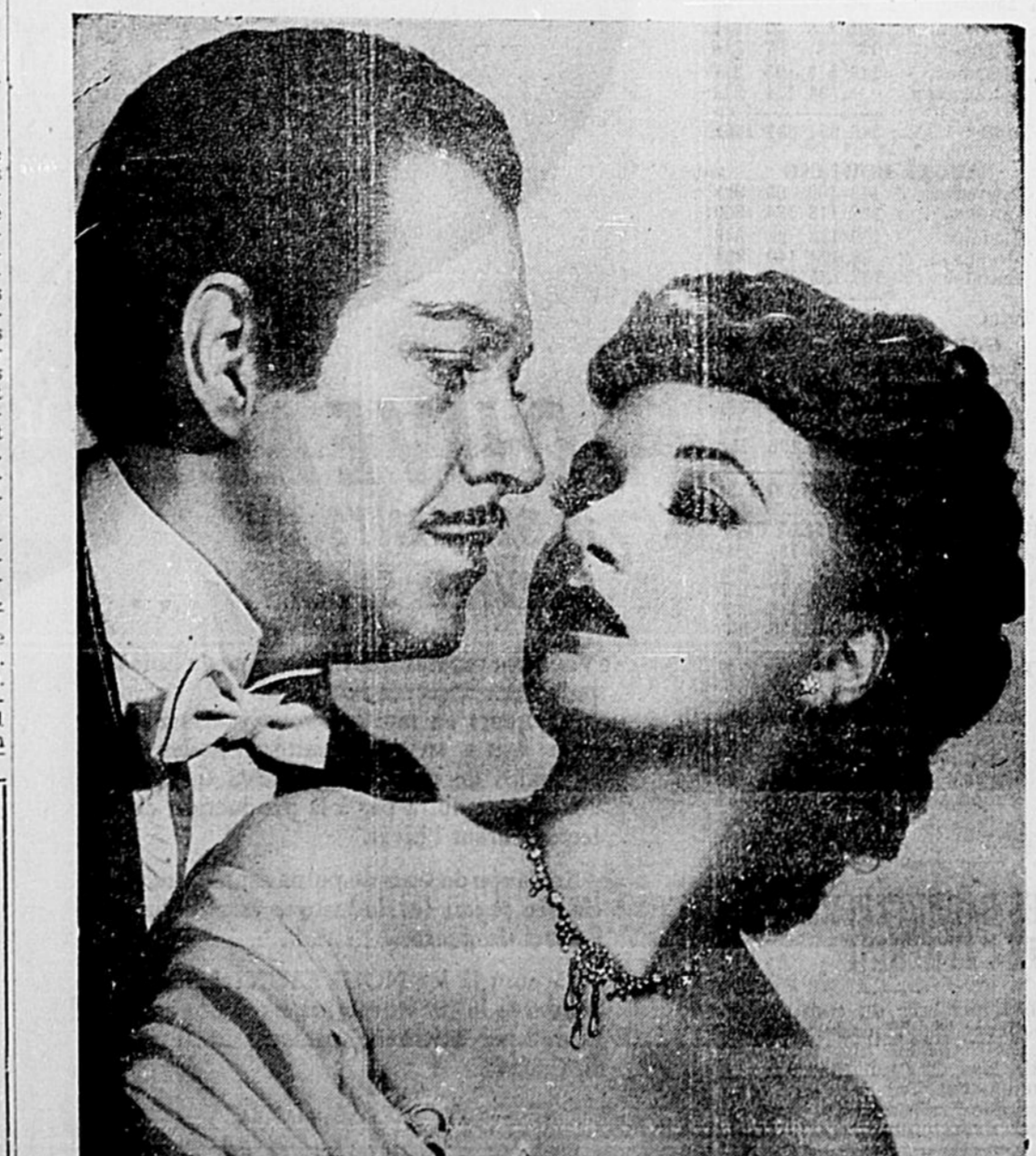
Une scène du grand succès "The Phantom of the Opera" qui passera sur l'écran du cinéma Maska durant 5 jours — de mardi à samedi — les 30 novembre 1, 2, 3 et 4 décembre en matinée et soirée.