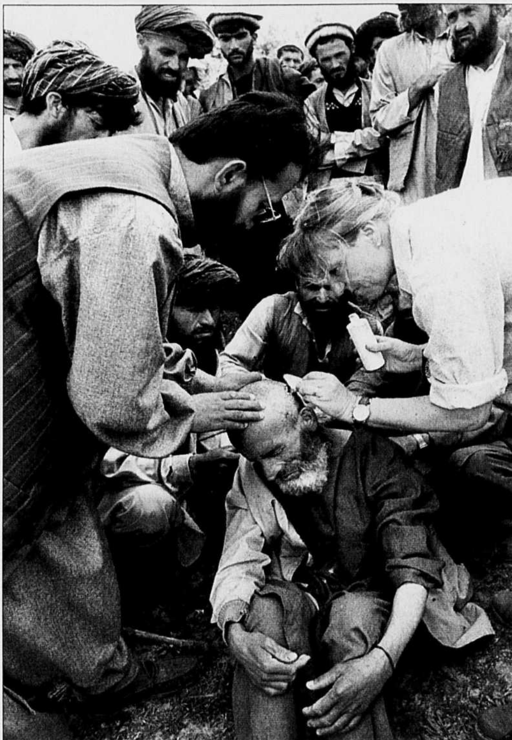
Premiers soins donnés dans un camp afghan après le séisme de 1998.