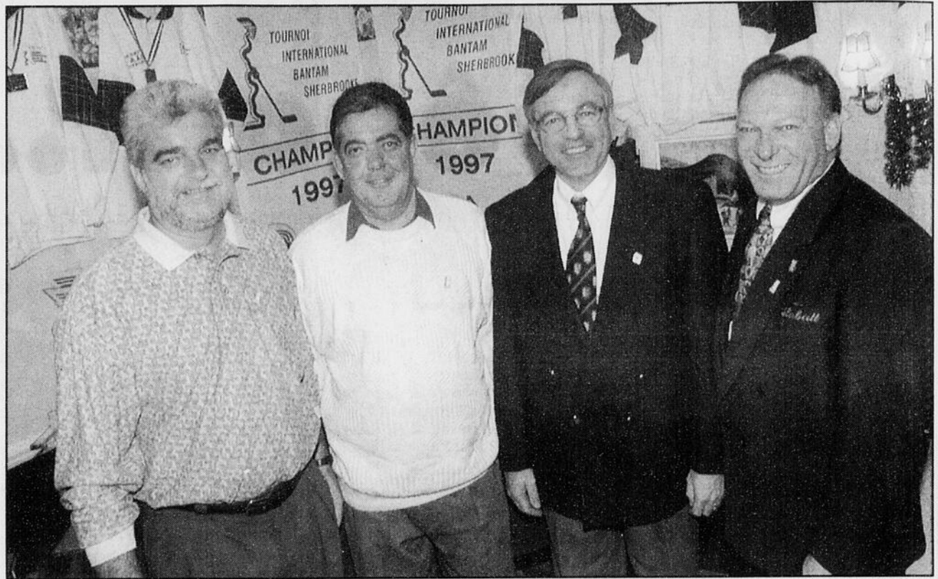
Imacom-Daguerre, Martin Blache