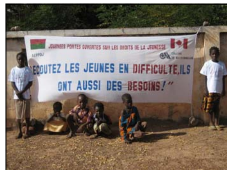
Bannière des journées portes ouvertes

Le jeu d'images — Les images dessinées par des membres du groupe représentent des jeunes dans différentes situations. Une fois exposées devant des groupes d'enfants et de jeunes, des animateurs les font s'exprimer sur le sens de ces images. C'est une occasion de dialogue et de sensibilisation unique. Et surtout, cette façon d'intervenir peu coûteuse suscite beaucoup d'enthousiasme auprès des groupes qui participent très activement et sont capables d'en tirer les leçons de vie qu'elle sous-tendent.