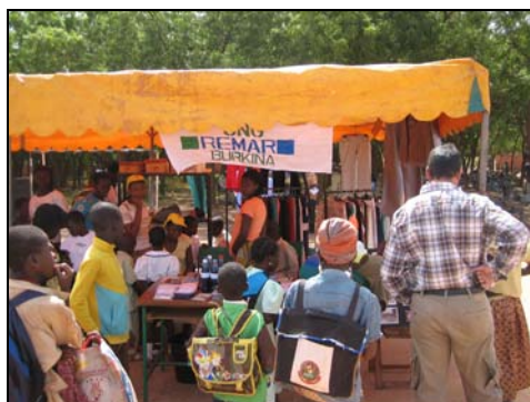
Un des stands d'exposition