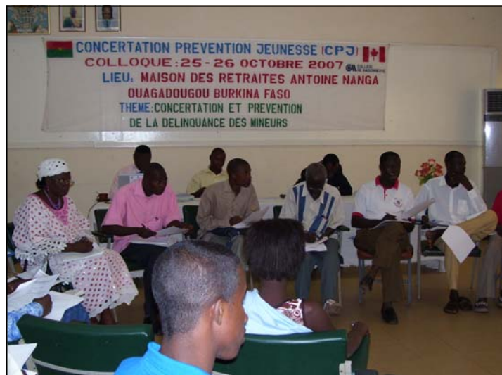
Colloque au Burkina Faso, octobre 2007

Au Burkina, 48 % de la population a moins de 15 ans. La ville de Ouagadougou, comme les grandes villes du Québec, attire beaucoup de jeunes. Ils se retrouvent à errer dans la ville, à