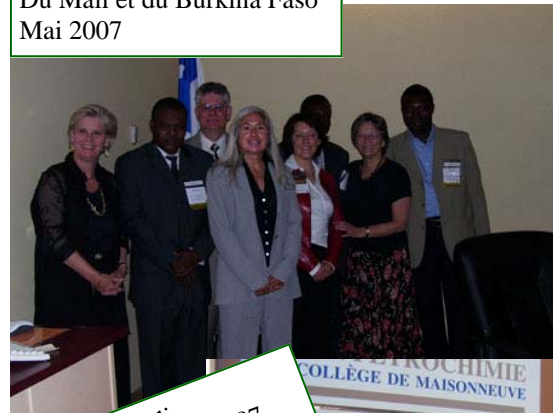
Du Mali Septembre 2007