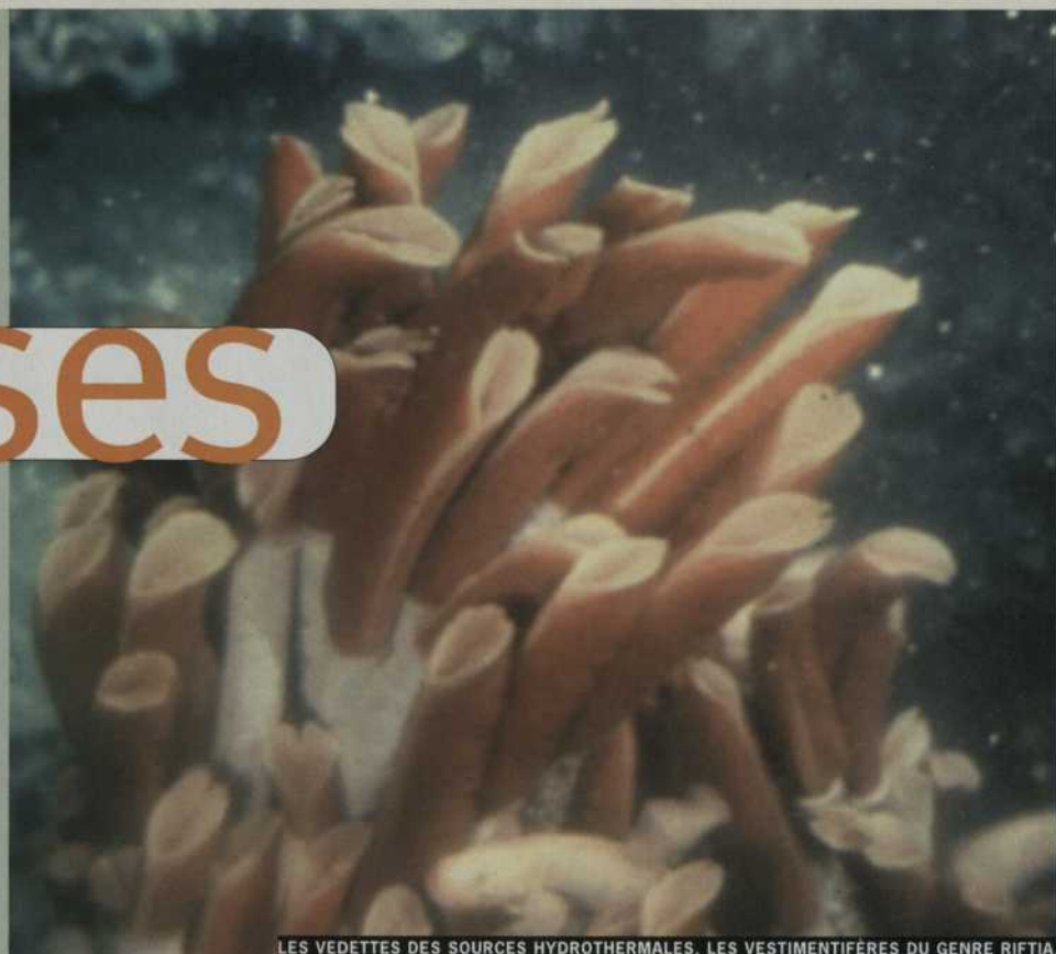
LES VEDETTES DES SOURCES HYDROTHERMALES. LES VESTIMENTIFÈRES DU GENRE RIFTIA.

Comment réagissent les espèces face à de telles intempéries? C'est justement l'évolution temporelle des communautés colonisant les structures hydrothermales actives qui intéresse notre équipe de recherche, dirigée par le Dr Juniper de l'Université du Québec à Montréal. Pour la première fois, une cheminée hydrothermale située à 2600 mètres au fond du Pacifique fut imagée pendant plusieurs années à l'aide de sous-marins. L'analyse consciencieuse des