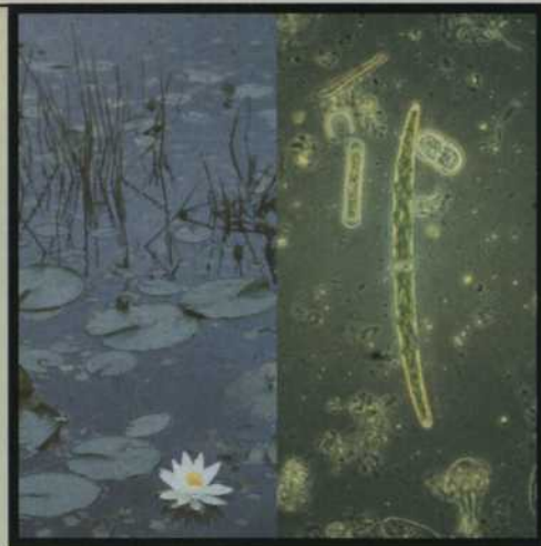
EAU D'ÉTANG GROSSIE 400 FOIS.