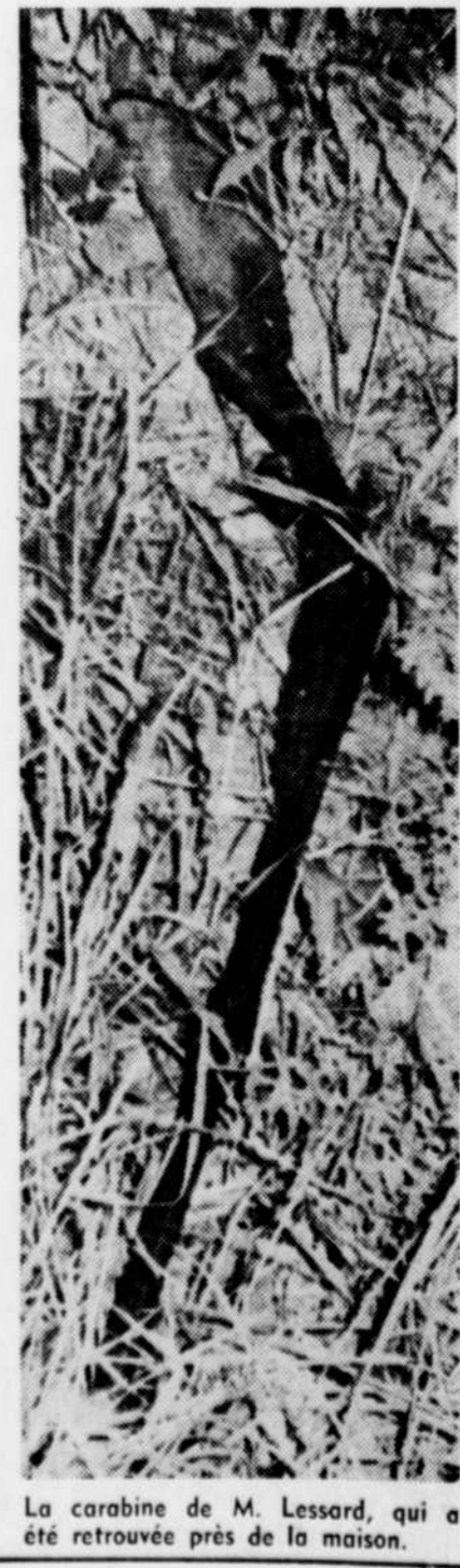
La carabine de M. Lessard, qui a été retrouvée près de la maison.