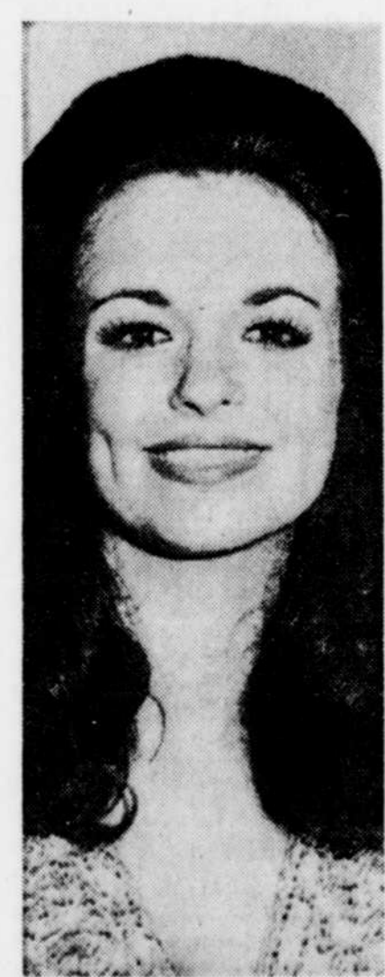
MISS AMERICA — C'est Phyllis George, une brune de 21 ans, qui a remporté le titre de Miss America, à Atlantic City. Elle est de Denton et représentait le Texas. A peine couronnée... elle a perdu sa couronne... elle était fort émue.

Le gouvernement britannique a pris samedi soir, pour la première fois depuis le début de la crise créée par les détournements d'avion, l'initiative de faire une promesse solennelle, destinée,