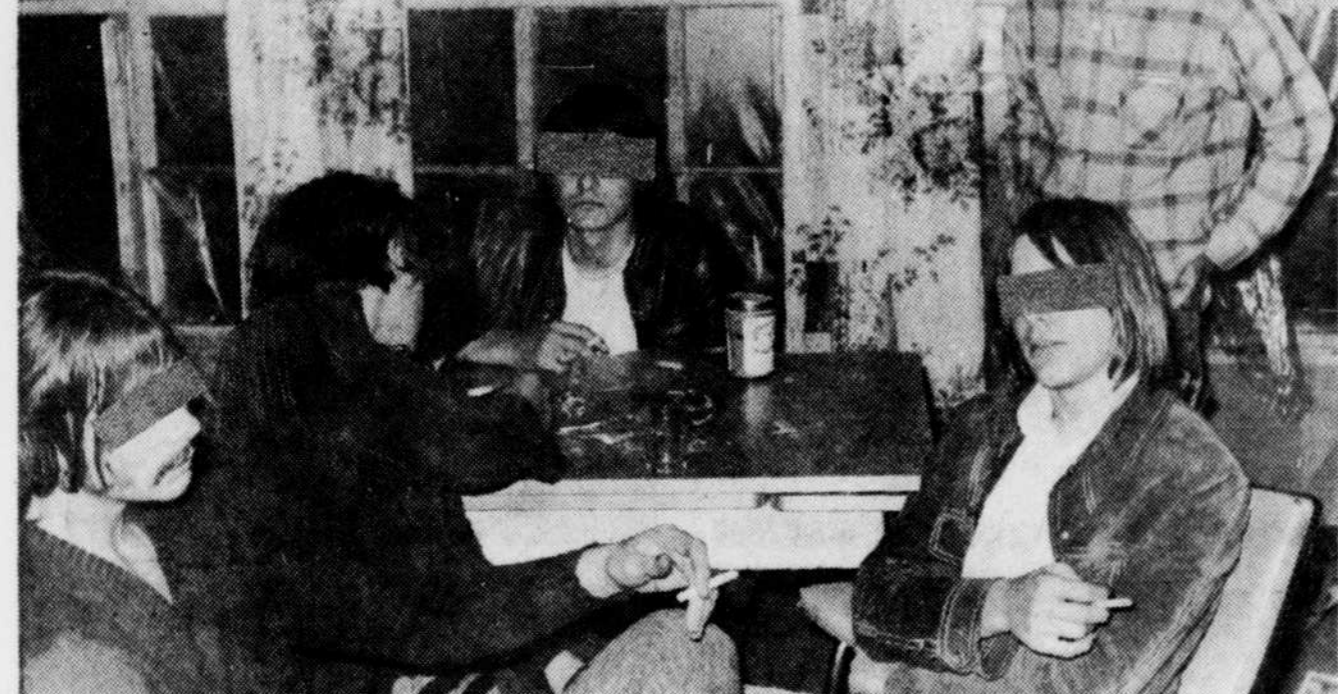
Des adolescents ont été surpris par une descente de police dans une maison de Deauville où on a découvert de la drogue, dans la nuit de samedi à dimanche.

Des neuf adolescents, il y avait huit garçons et une fille. Certains sont étudiants et d'autres chômeurs.