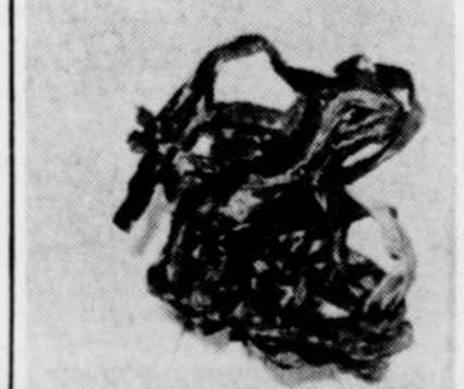
Le ruban gommé noir qui a servi aux bandits à ligoter les six personnes...