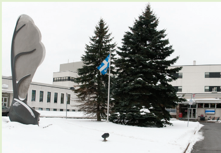
Le Centre hospitalier de LaSalle