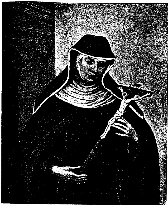
LA VÉNÉRABLE MARIE-CRESCENCE HÖSS.