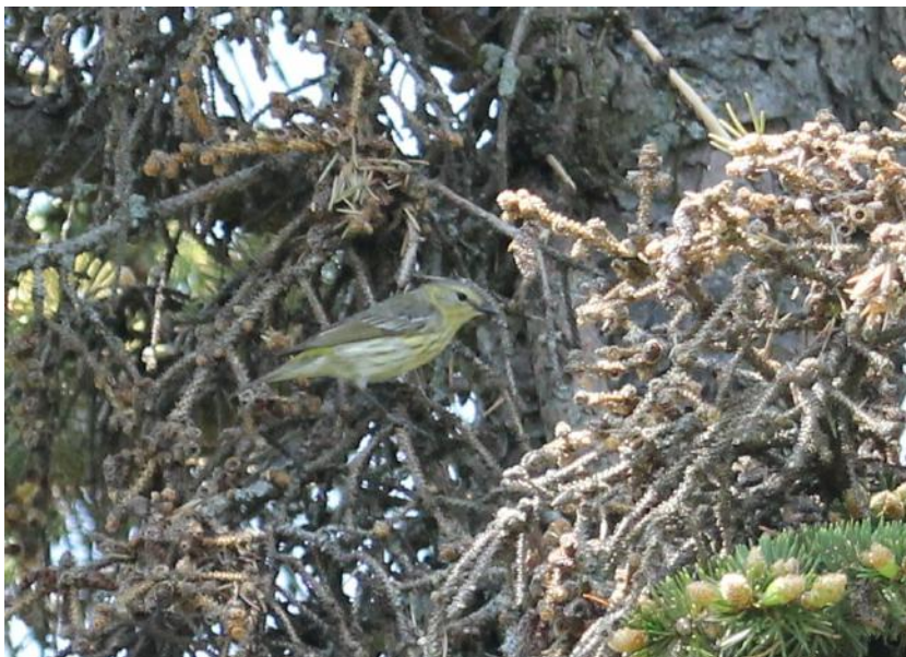
Figure 7 Paruline tigrée par Luc Laberge

Les parulines forment un groupe de passereaux très apprécié des ornithologues. Au printemps, mâles et femelles arborent leurs plus belles couleurs. Elles sont ravissantes, éclatantes dans leur plumage nuptial. Habituellement, en période de nidification, elles sont faciles à identifier. Ce printemps, lors de la sortie annuelle, une paruline nous a intrigués. Personne n'a été capable de l'identifier sur le terrain. Elle était active, se déplaçait, des fois à contre-jour, constamment à la cime des arbres feuillus et des conifères. Elle a animé la première journée de la sortie annuelle. Nous l'avons observée au Parc Brébeuf, à Gatineau. C'est un parc urbain, à proximité d'une école, de terrains de tennis, entre une rue résidentielle et la rivière Outaouais. La végétation est variée; on y trouve des espaces ouverts gazonnés, des arbustes, des feuillus et des conifères matures. Tous les participants du groupe l'ont vu mais personne ne pouvait l'identifier avec certitude. À partir des premières observations, nous pensions à une Paruline des pins. Après plusieurs minutes d'observations et plus de détails, la situation se complique. Il y a trois hypothèses : Paruline des pins, Paruline à couronne rousse et Paruline tigrée (avec la photo, c'est facile).