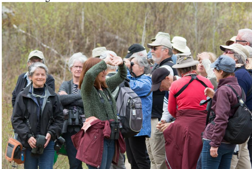
Figure 2 Deuxième groupe ( en semaine)