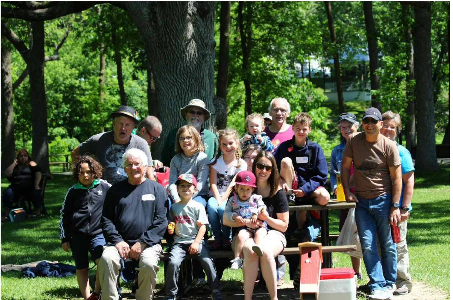
Figure 6