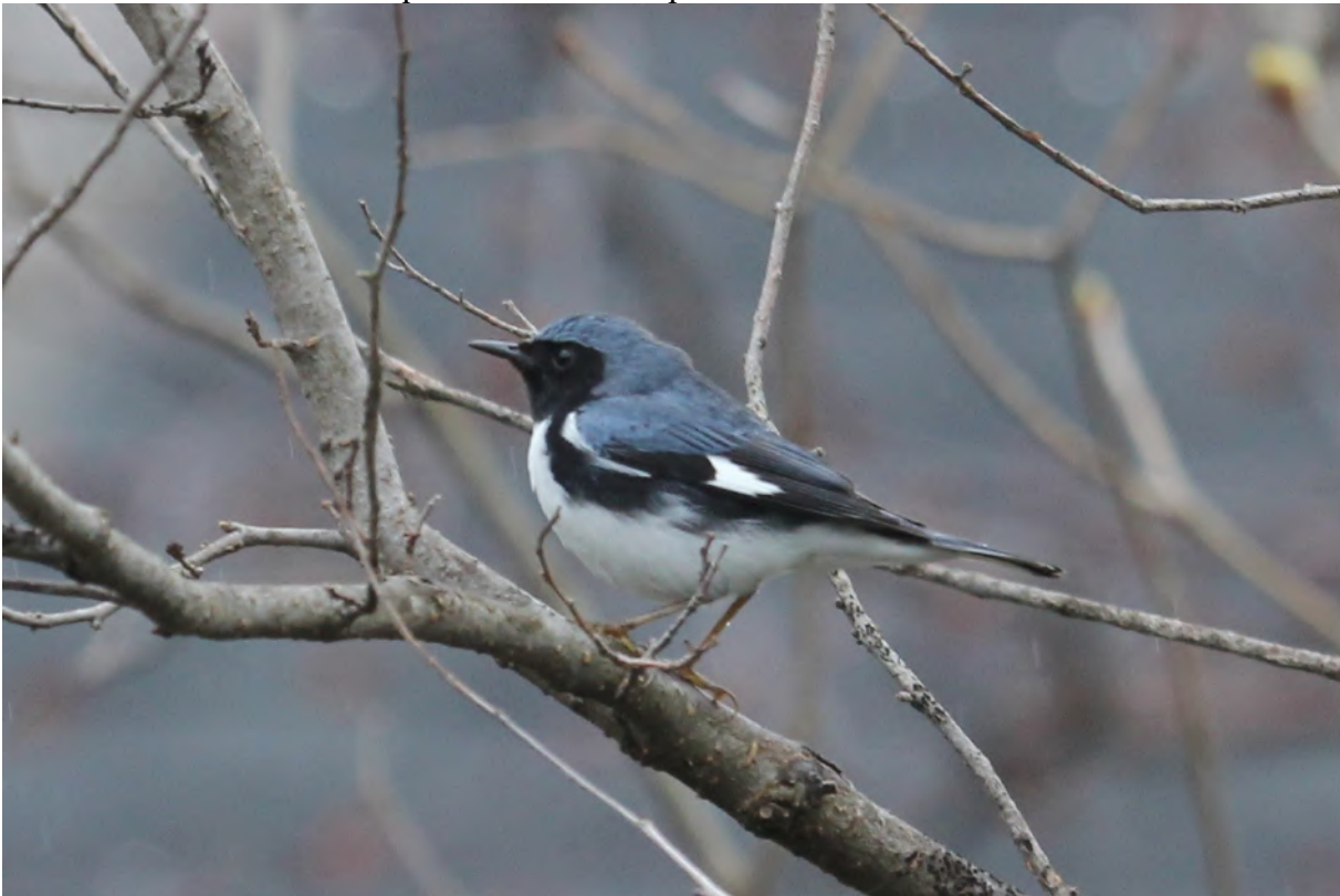
Figure 5

Le nid est installé à un mètre du sol dans un endroit où la végétation est dense. L'oiseau pond de trois à cinq œufs et peut élever deux nichées durant la belle saison. Lorsqu'il se nourrit, il oriente son choix vers les chenilles de toutes sortes. Il peut aussi s'attaquer à d'autres arthropodes. Occasionnellement, il peut consommer de petits fruits et du nectar. Cet oiseau, surtout le mâle, est d'une rare beauté. Il est superbe toute l'année, mais lorsque le feuillage tourne au jaune ou rouge à la fin de l'été, le contraste marquant entre le bleu de l'oiseau et les couleurs chaudes des feuillus ont de quoi émerveiller le passant observateur.