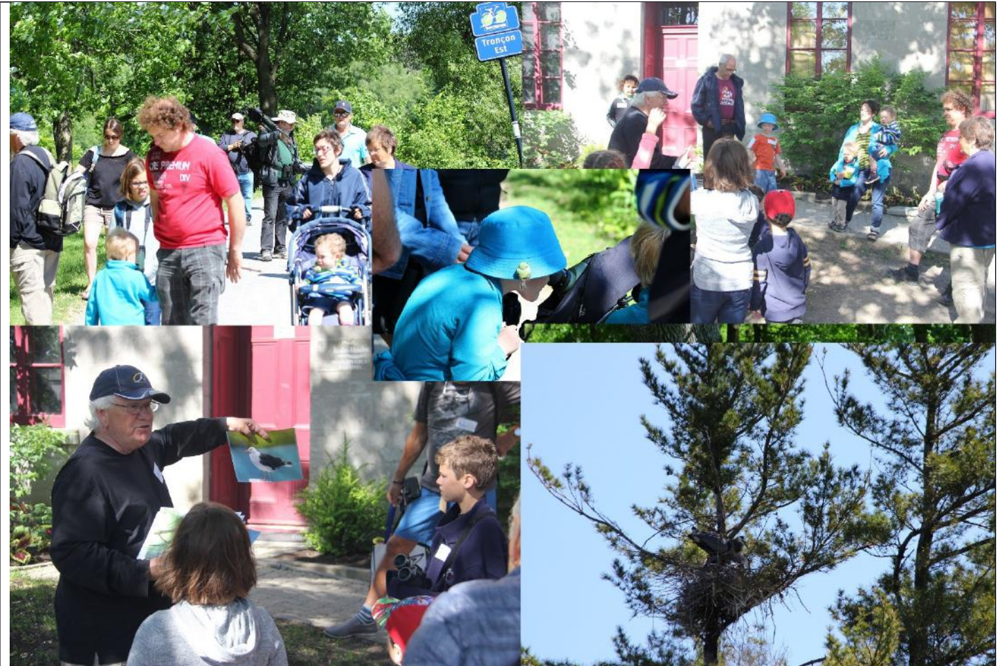
Figure 1