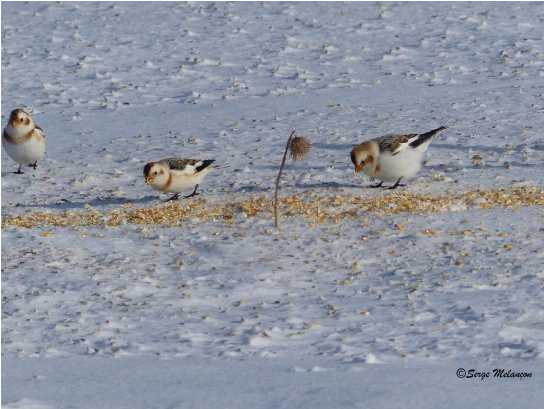
Une fois l'emplacement sécurisé, c'est tout le groupe qui s'amène.