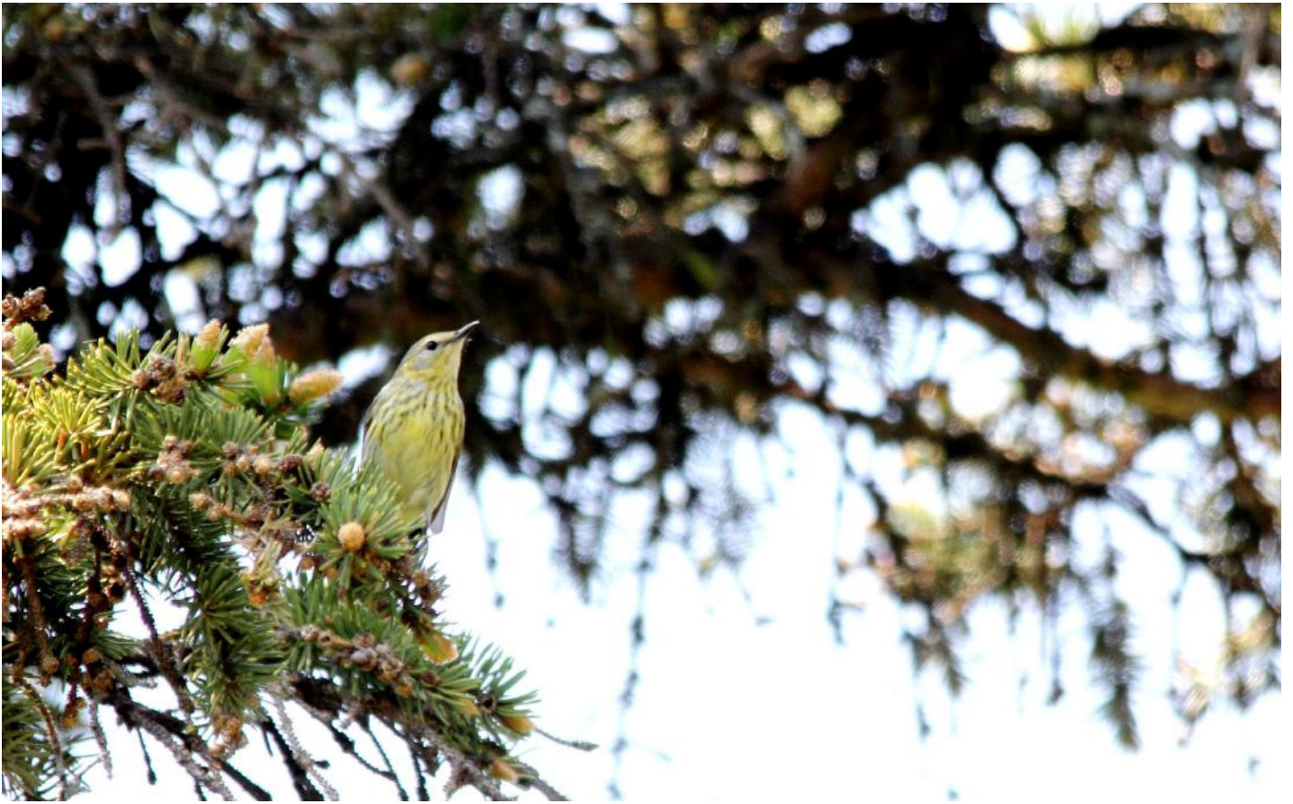
Figure 8 la même Paruline tigrée, par Gilles Cyr