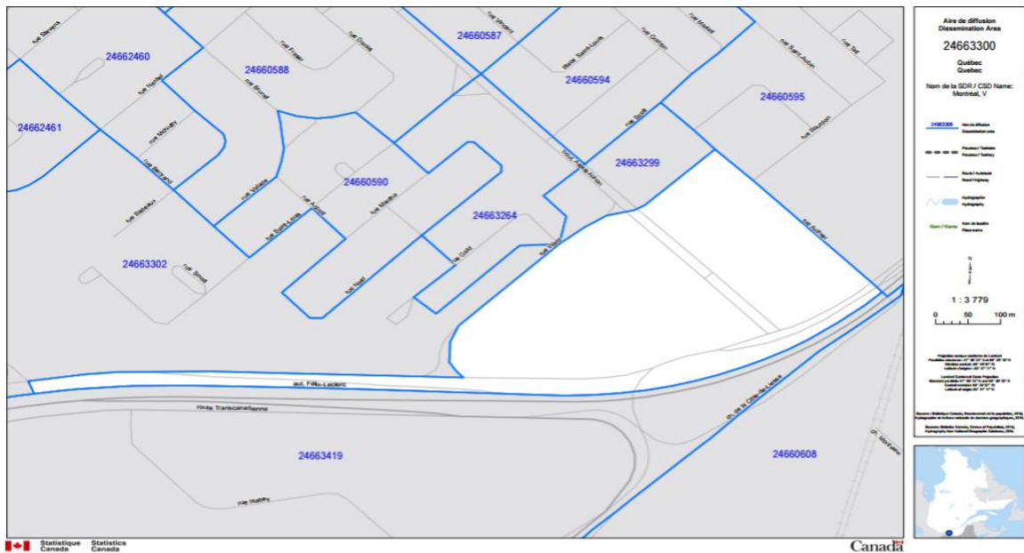
Carte 3 : Aire de diffusion 24663300, Ward