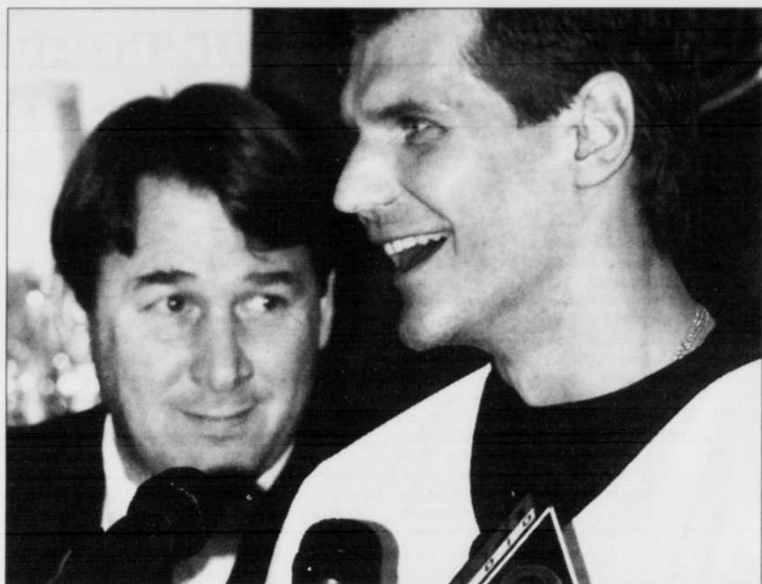
Alexei Yashin, 27 ans, était bien content de signer le contrat qui lui rapportera près de 90 millions $US. Le directeur général des Islanders ne semblait pas regretter son choix.