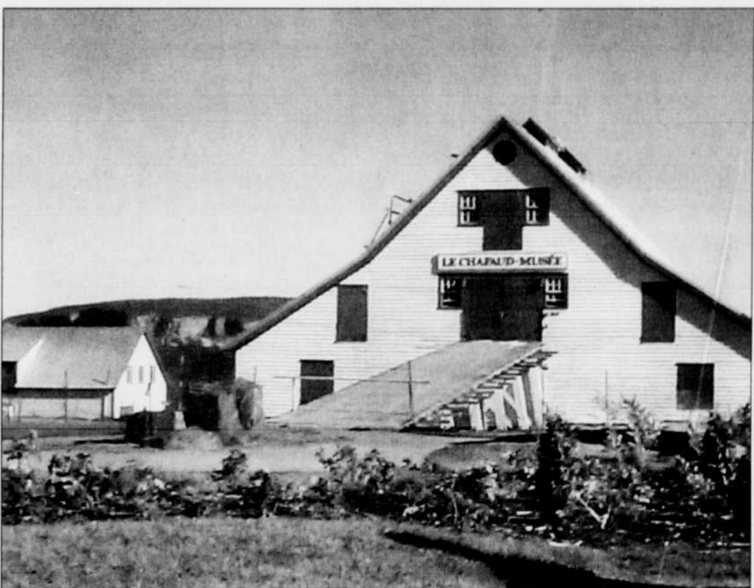
Le musée Le Chafaud de Percé est au cœur d'une véritable guerre historique.

La Direction de la santé publique, qui souligne qu'une autre retombée positive de l'étude concerne l'information transmise aux responsables des aires de jeux, tient à souligner l'excellente collaboration des autorités municipales et scolaires dans la réalisation du projet.