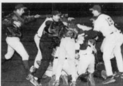
LES DIAMANTS CHAMPIONS 26