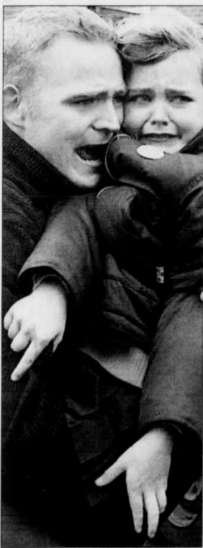
Panique à Belfast. L'explosion d'une bombe artisanale a blessé quatre policiers chargés de la protection des jeunes élèves d'une école catholique. Page A19.