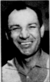
Ben Hogan, photographié en 1951.

(AP) — L'un des plus grands champions de golf, l'Américain William Ben Hogan, est mort hier chez lui à Fort Worth au Texas, à l'âge de 84 ans. Son palmarès exceptionnel en a fait une figure emblématique de l'histoire du golf. Son chapeau blanc, son visage inexpressif restent légendaires.