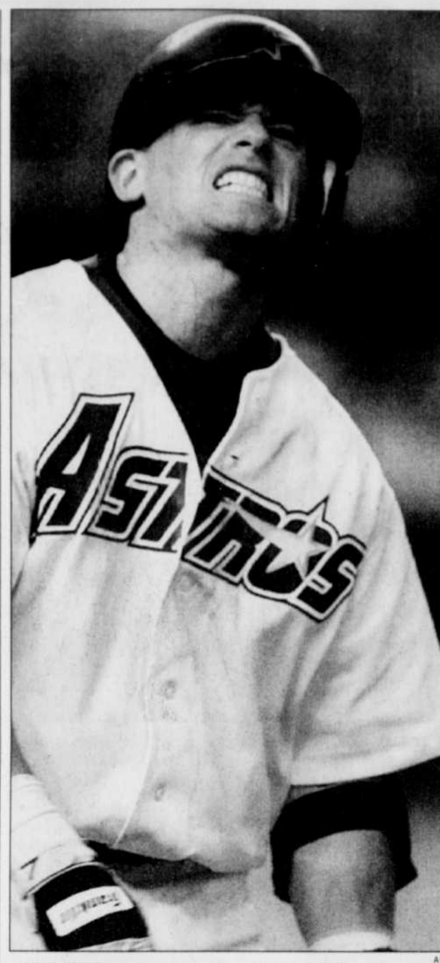
Craig Biggio grimait après avoir été atteint au bras par un lancer de Jeff Juden à la 3 e manche.