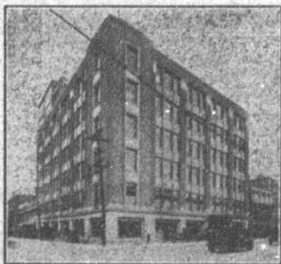
Le nouvel édifice Dupuis Frères, érigé par Archambault & Leclair, Ingénieur: Arth. Surveyer; Architecte: H. S. Labelle.