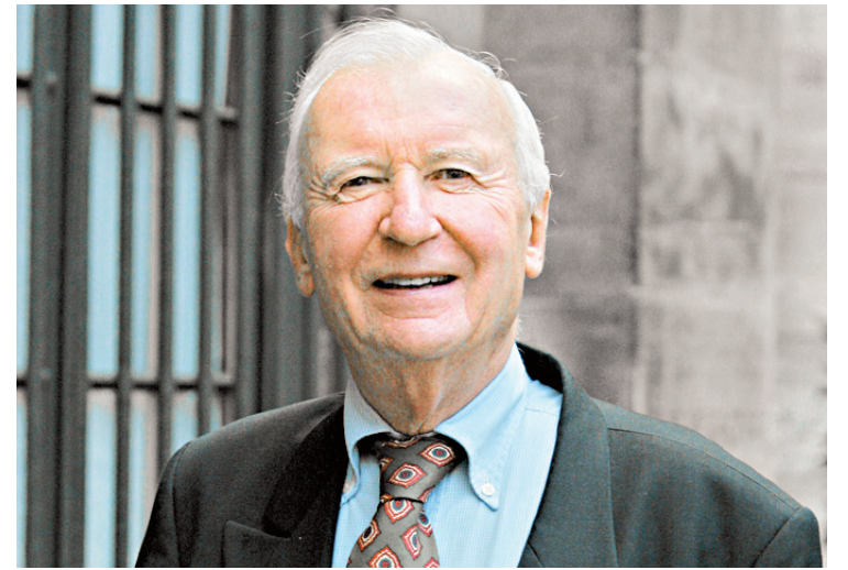
L'écrivain français Bernard du Boucheron