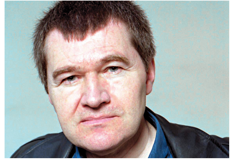
Le romancier Antoine Volodine