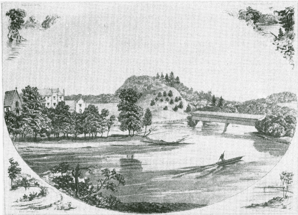
Confluent de la rivière Massawippi avec la St-François en 1860. Cette photo a été prise à Lennoxville. A gauche le Collège Bishop et la chapelle de style gothique. W.S. Hunter, Jr.