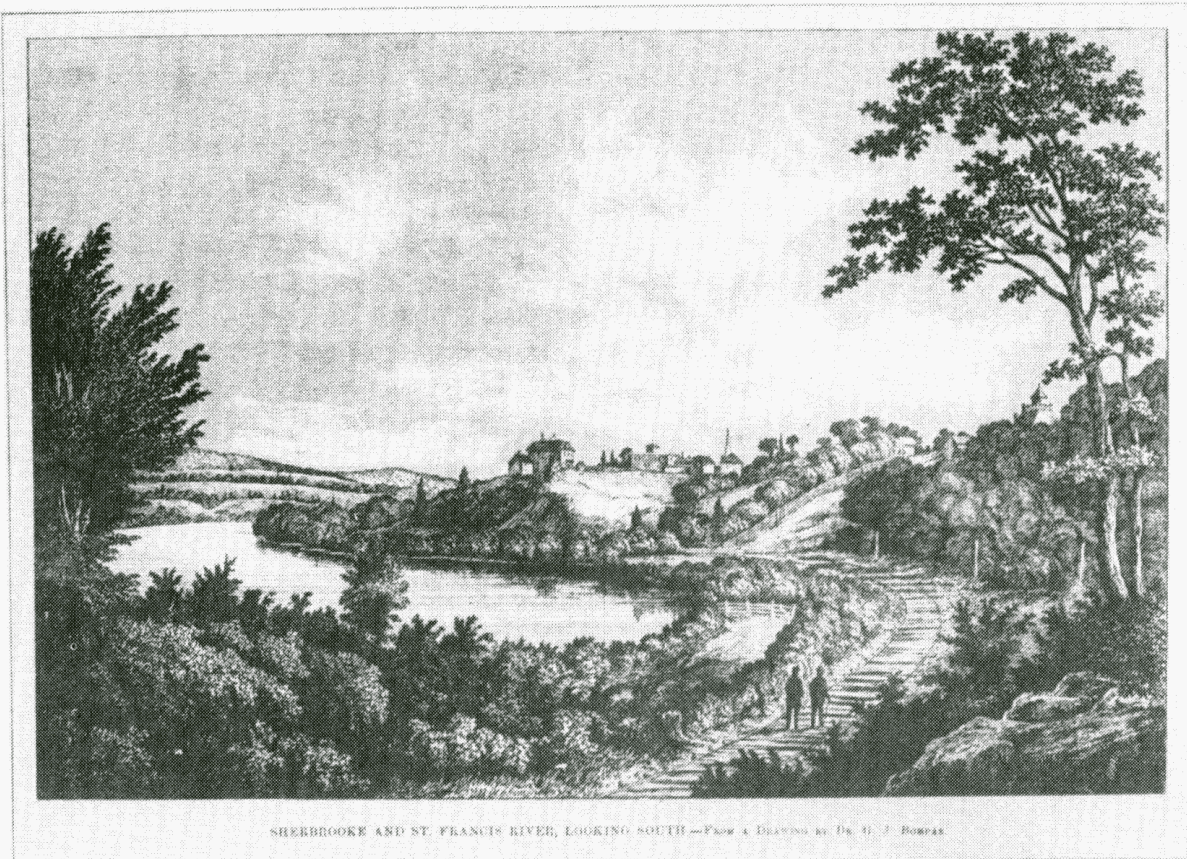
Sherbrooke et la rivière St-François se dirigeant vers le sud (1870) "Canadian Illustrated News" (24 déc. 1870)

Bulletin officiel de la Société de Généalogie des Cantons de l'Est Inc. Membre de la Fédération Québécoise des Sociétés de Généalogie