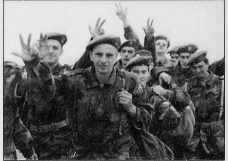
Une centaine de soldats serbes se sont retirés du Kosovo, hier, sous le regard des médias...

Le Viagra se vend de 12 $ à 13 $ le comprimé.