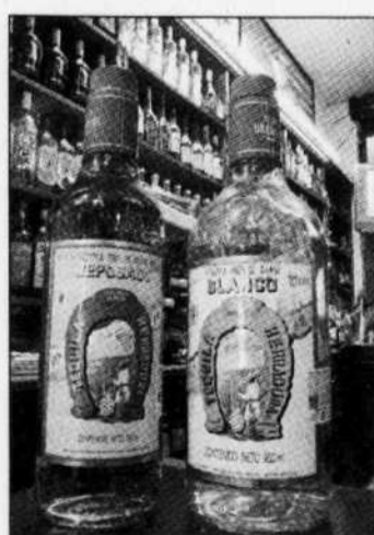
Davantage de Canadiens conduisent en état d'ivresse.

M. Vanlaar soupçonne plusieurs facteurs d'être à l'origine de l'arrêt des progrès, mais il désigne comme facteur contributif important les récidivistes de l'alcool au volant. L'an dernier, ceux-ci ont effectué 6,6 millions de déplacements sous l'influence de l'alcool au Canada, ce qui représente environ