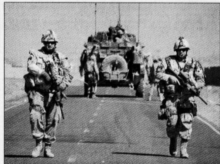
Le Parlement aura à se prononcer bientôt sur le genre de mission que devrait entreprendre le Canada après la fin de son mandat actuel, en février 2009.