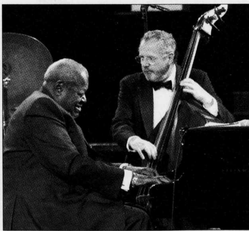
Oscar Peterson et Nils Henning Orsted-Petersen (décédé en 2006) au cours d'un concert donné à Berne, en Suisse, au printemps 2000.

À peine associé à Granz, Peterson devint le pivot rythmique du Jazz At The Philharmonic (JATP) . Comme ce nom l'indique, il s'agissait de présenter des musiciens dans des salles aussi grandes qu'ornementées. Au cours de cette aventure, qui fut d'ailleurs longue,