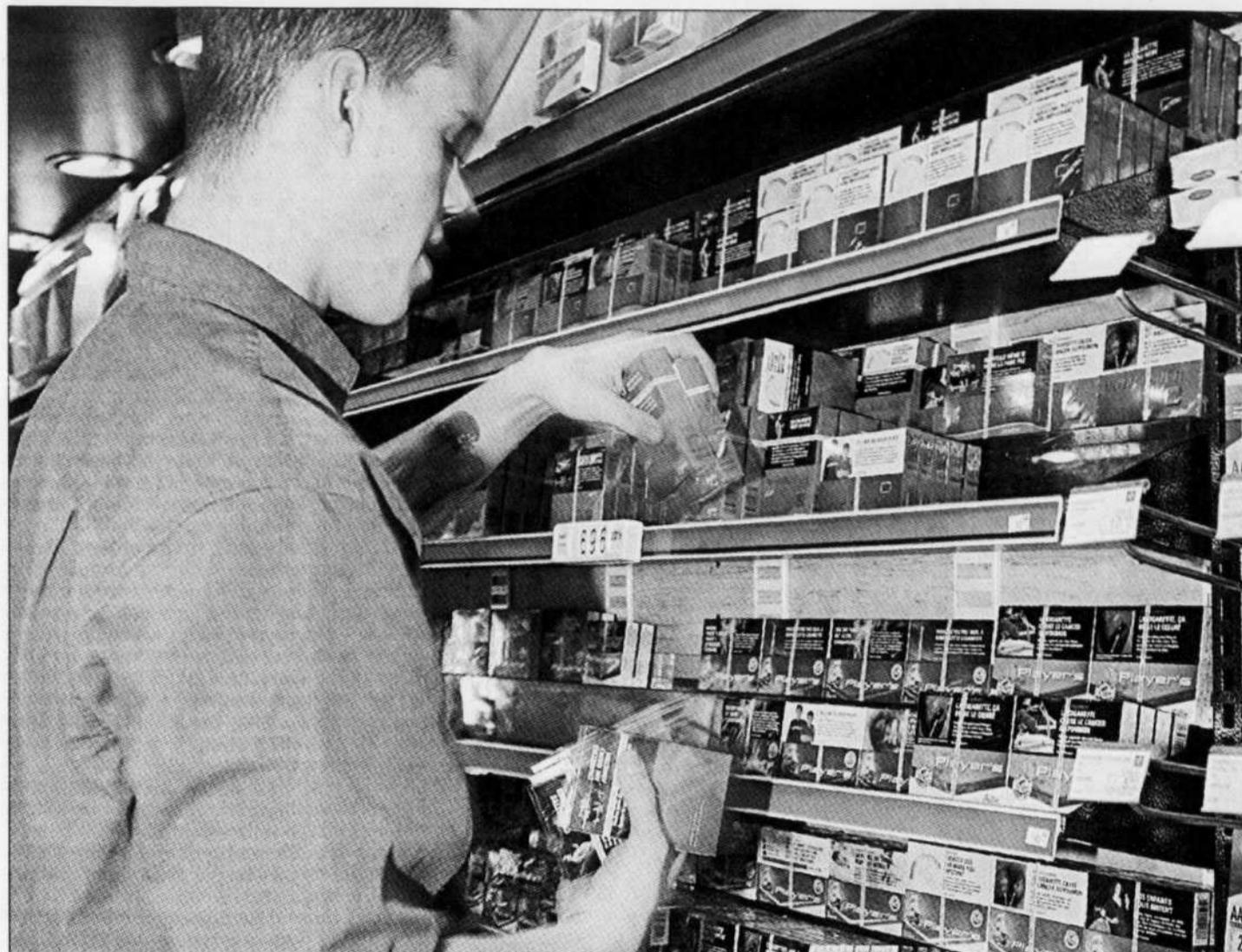
L'État québécois a dépensé 55 millions entre 2000 et 2004 pour aider — souvent avec succès — les fumeurs à écraser. Bientôt, de nouvelles mesures dissuasives entrèrent en vigueur, notamment en ce qui concerne la présentation des cigarettes.