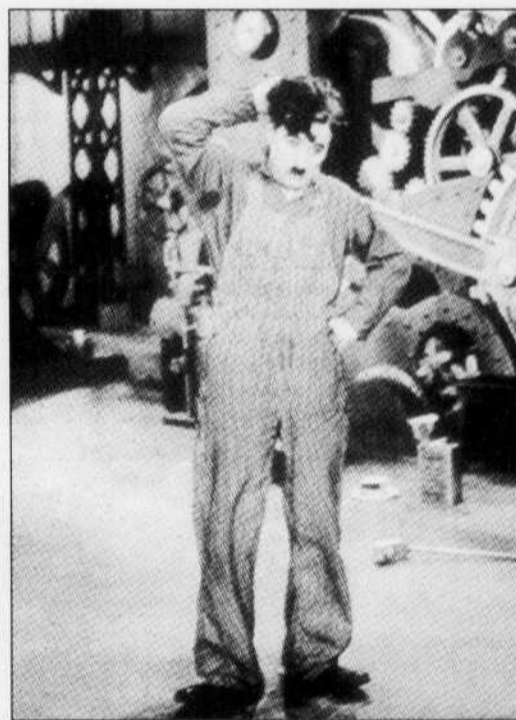
Chaplin dans Les Temps modernes (1936).

En 1952, au moment d'être considéré persona non grata aux États-Unis, il déclare: «J'aime la liberté, ce qui