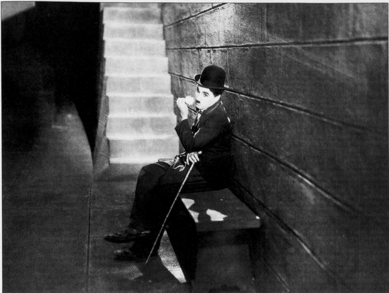
Charles Chaplin est mort le jour de Noël 1977; trente ans plus tard, il faut revoir l'œuvre de ce génie tragi-comique du cinéma et se souvenir de l'humaniste, de l'«agitateur de la paix», comme il aimait à se qualifier lui-même.