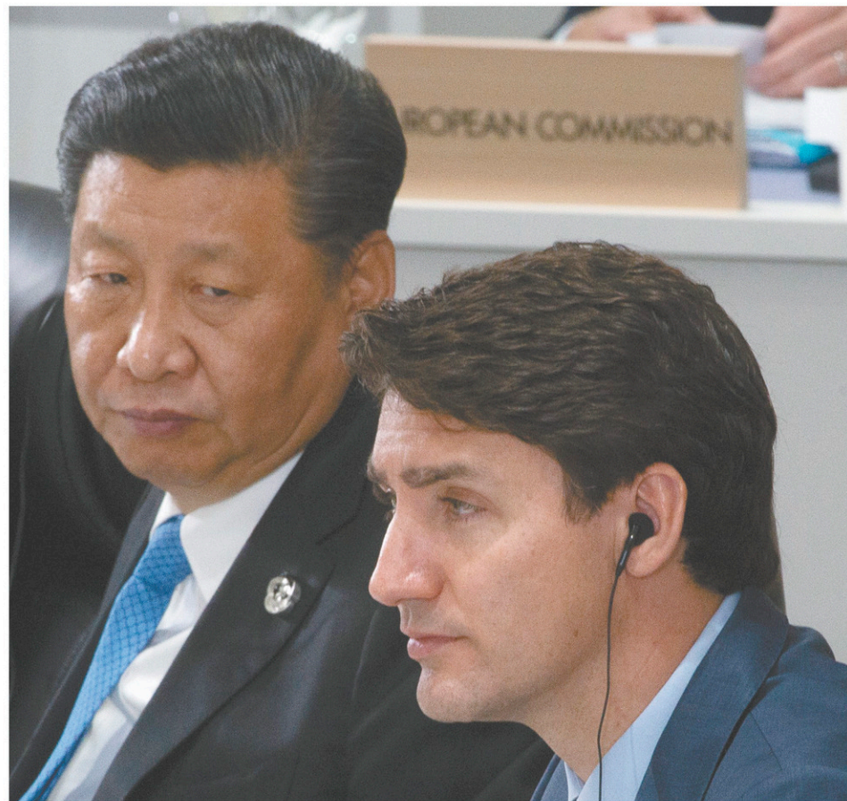
Le premier ministre Justin Trudeau et le président chinois, Xi Jinping, étaient assis côte à côte, vendredi, lors d'un déjeuner de travail, mais ont toutefois évité de se parler.

Pour tenter de percer ce mur, Ottawa s'appuie maintenant beaucoup sur l'influence du président américain, pour qu'il aborde la question lors de son tête-à-tête avec son homologue chinois samedi. Donald Trump s'est engagé à le