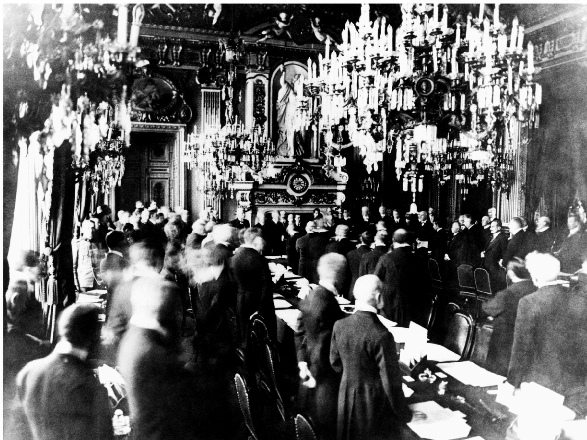
En haut : photo non datée du maréchal Ferdinand Foch, commandant les troupes alliées durant la Première Guerre mondiale. En bas : photo prise le 28 juin 1919 au château de Versailles lors de la signature, par les représentants des Alliés et ceux de l'Allemagne, du traité de Versailles.