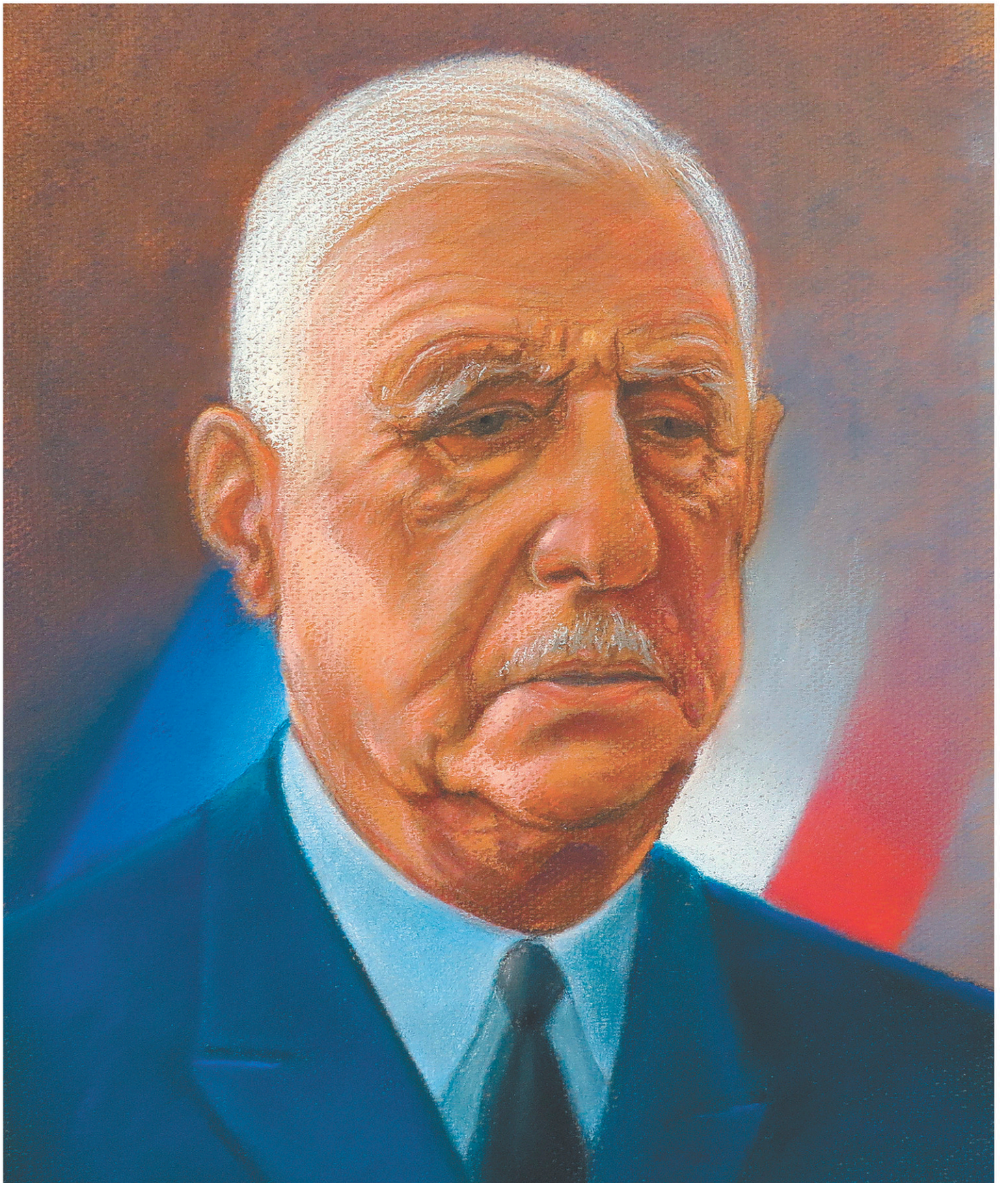
Le général de Gaulle avait compris que la liberté, pour la France, ce n'était pas uniquement d'être libre physiquement de l'occupation militaire, mais aussi d'être libre d'agir, de penser dans sa propre logique, pour elle-même et par elle-même.

Pour de Gaulle, la France est un grand pays, un grand peuple avec une grande culture qui possède un passé glorieux, un présent et un avenir. La France est