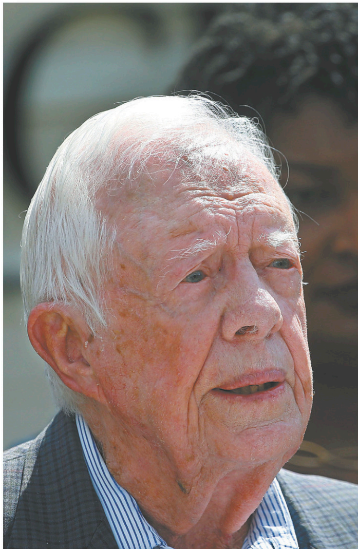
L'ex-président Jimmy Carter en septembre 2018