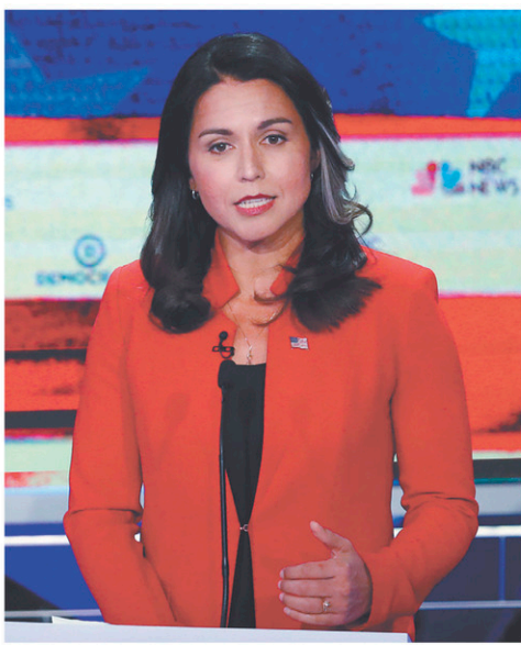
La grande gagnante du double débat des candidats démocrates, en vue de la prochaine élection présidentielle aux États-Unis, aura finalement été Tulsi Gabbard. Photo de droite : Joe Biden, Bernie Sanders, Kamala Harris et Kirsten Gillibrand.

Quatrième dans les sondages, derrière Elizabeth Warren, Bernie Sanders — qui a réussi à imposer ses idées, mais un peu moins sa personne — et Joe Biden, Kamala Harris a créé ce « moment » que cherchent inlassablement les commentateurs dans chaque débat. Comment ? En attaquant le coureur de tête, l'ex-vice-président Biden, sur son historique politique en matière de droits civiques, sa complaisance passée envers des sénateurs ségrégationnistes et son opposition à une loi fédérale sur le transport scolaire que