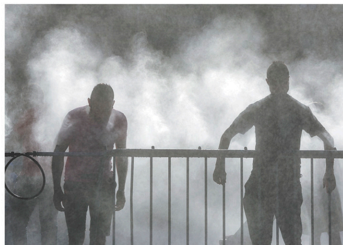
Des habitants de Strasbourg se rafraîchissaient vendredi.

Le phénomène du « street pooling » — qui permet de se rafraîchir dans les rues — est fréquent en période de cani-