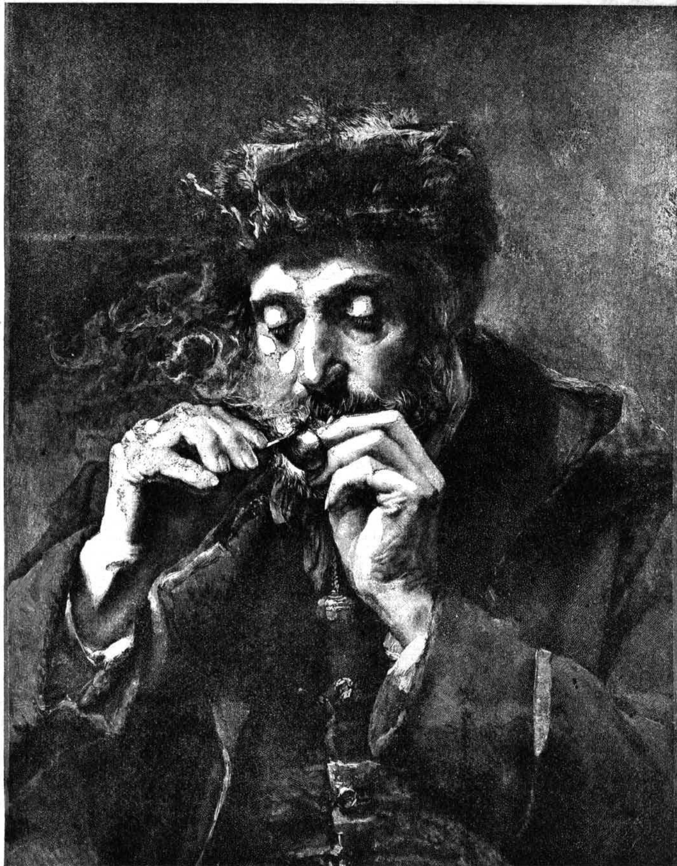
UNE BONNE PIPE — Tableau de M. H. Umbright