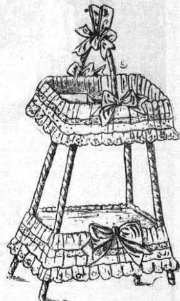
TABLE A OUVRAGE, complètement recouverte de mousseline blanche à pois mats. Les volants garni d'une dentelle et d'un entre-deux. Noeuds de ruban sur l'anse et sur le côté. Les pieds de table sont enroulés de ruban. Dans l'étage supérieur de cette table, une petite pelote et une pochette sont ménagées, dans cette dernière se place le fil, les ciseaux et les menus objets pour travailler.