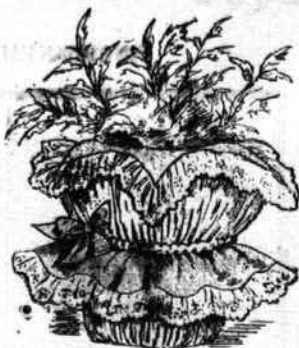
CACHE-POT GARNI DE SOIE ET DE DENTELLE

Une jolie combinaison faite par un grand couturier est la réunion du drap avec un voile vapoureux. Sur une jupe de drap biscuit très plate du haut, trois draperies en voile, même ton, se nouaient sur le côté ; le corsage taillé en cœur devant et derrière.