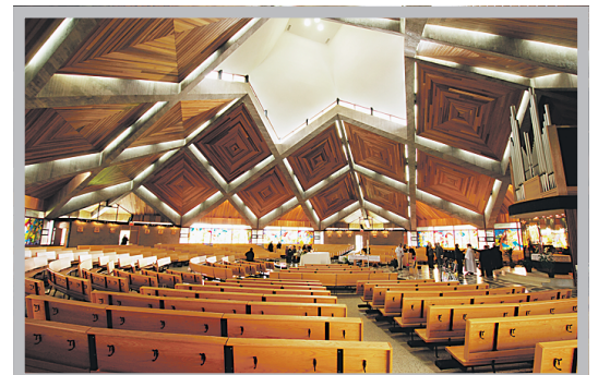
Église Notre-Dame-Immaculée, Roberval