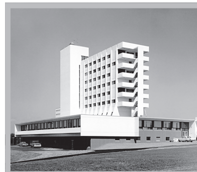
Résidence des Frères Maristes, Saint-Augustin