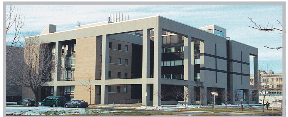
Pavillon Charles-Eugène-Marchand, Université Laval