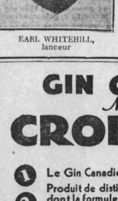
EARL WHITEHILL, lanceur