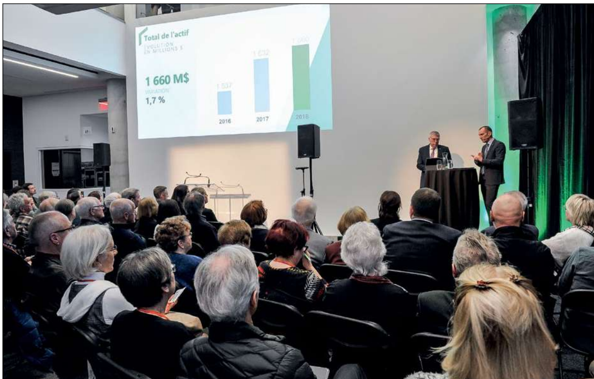
Plus de 175 membres ont assisté à l'assemblée générale annuelle.