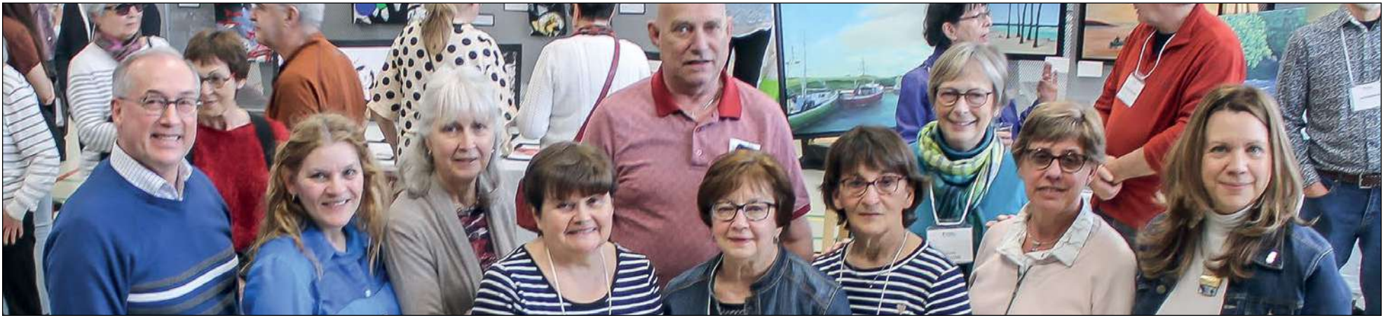
Des membres de l'organisation, en compagnie de Rémy Normand, président de l'arrondissement de Sainte-Foy-Sillery-Cap-Rouge et conseiller municipal du district du Plateau (à gauche sur la photo) et Anne Corriveau, conseillère municipale du district de la Pointe-de-Sainte-Foy (à droite sur la photo).