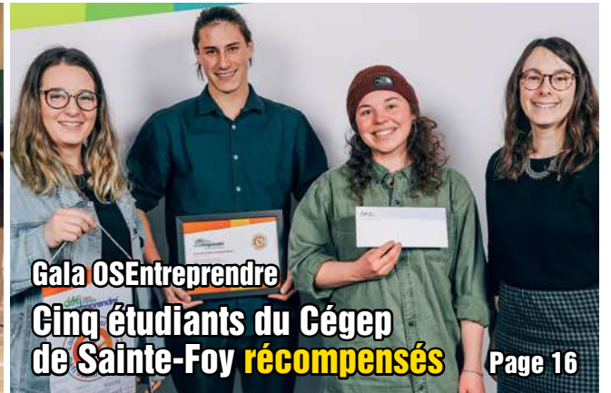
Gala OSEntreprendre Cinq étudiants du Cégep de Sainte-Foy récompensés