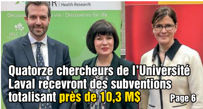
Quatorze chercheurs de l'Université Laval recevront des subventions totalisant près de 10,3 M$