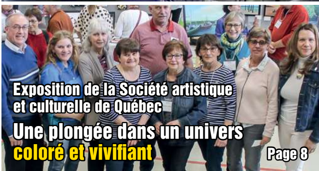
Exposition de la Société artistique et culturelle de Québec Une plongée dans un univers coloré et vivifiant