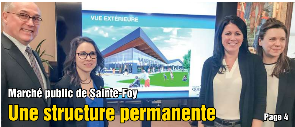
Marché public de Sainte-Foy Une structure permanente