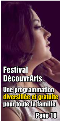
Festival DécouvrArts Une programmation diversifiée et gratuite pour toute la famille Page 10