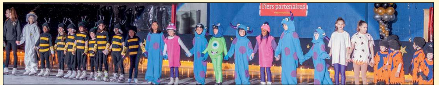
Les patineuses et patineurs ont présenté des numéros diversifiés où les costumes originaux étaient à l'honneur.