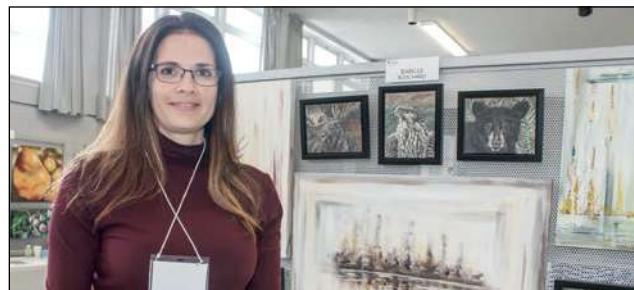
Isabelle Bouchard commence à explorer l'univers du figuratif abstrait avec des œuvres au fond blanc.