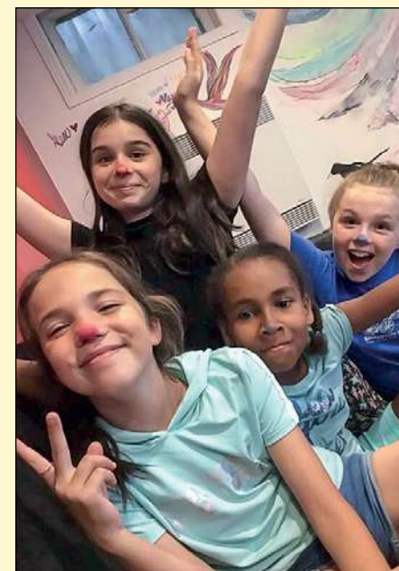
Cuistots en herbe s'adresse à une clientèle ayant peu de notions en matière de cuisine, mais qui désire en acquérir, et ce, dans une atmosphère de plaisir.

Pour information ou inscription : mdjlenvol.com (section Documents à télécharger) ou par téléphone au 418 656-6039. ■