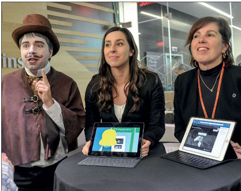
Les membres, à la recherche d'indices, devaient parcourir cinq stations.