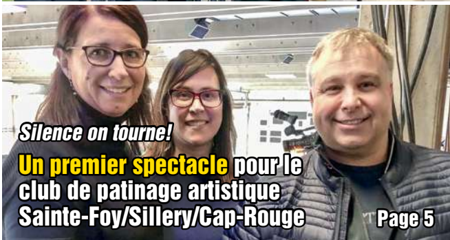
Silence on tourne! Un premier spectacle pour le club de patinage artistique Sainte-Foy/Sillery/Cap-Rouge