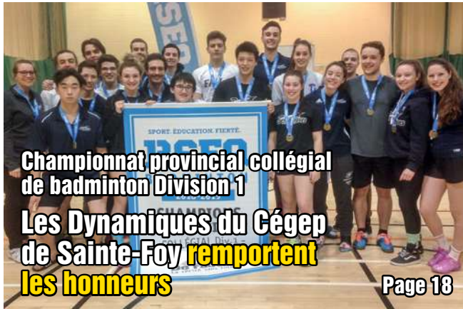
Championnat provincial collégial de badminton Division 1 Les Dynamiques du Cégep de Sainte-Foy rempoient les honneurs