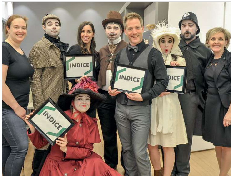
Les comédiens sans bagage assuraient l'animation du jeu d'enquête, en collaboration avec les employés de la Caisse.