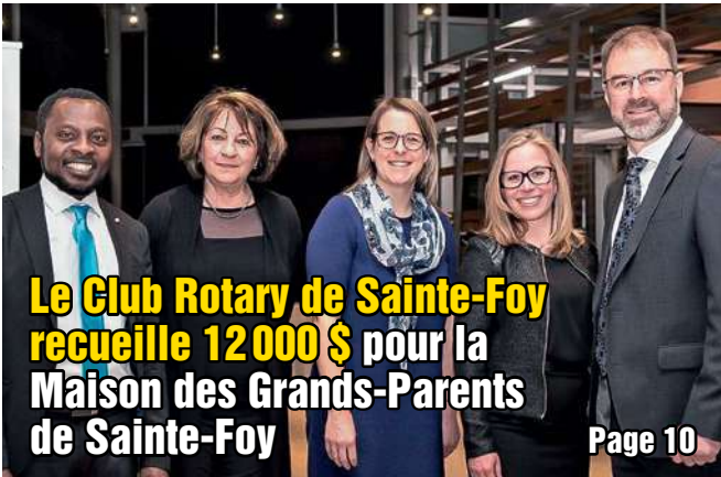
Le Club Rotary de Sainte-Foy recueille 12 000 $ pour la Maison des Grands-Parents de Sainte-Foy