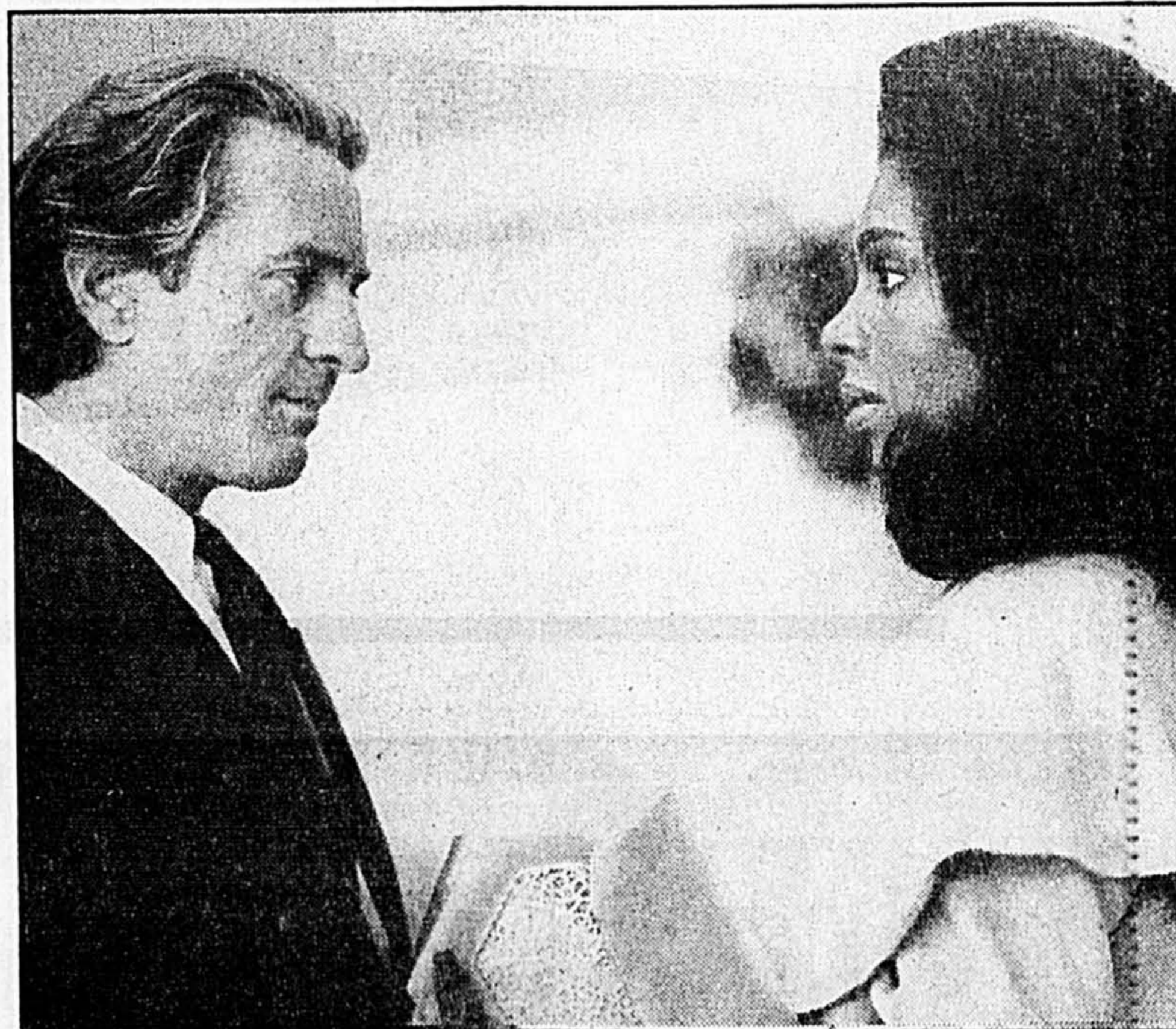
Deux des principaux interprètes de «Mistress», Robert De Niro et Sheryl Lee Ralph.

Comédie dramatique plutôt bavarde et mise en scène sans magie, Mistress suscite un intérêt intermittent, avant de s'essouffler sérieusement vers la fin. Sauvé de justesse par le jeu des acteurs chevronnés auxquels elle fait appel.