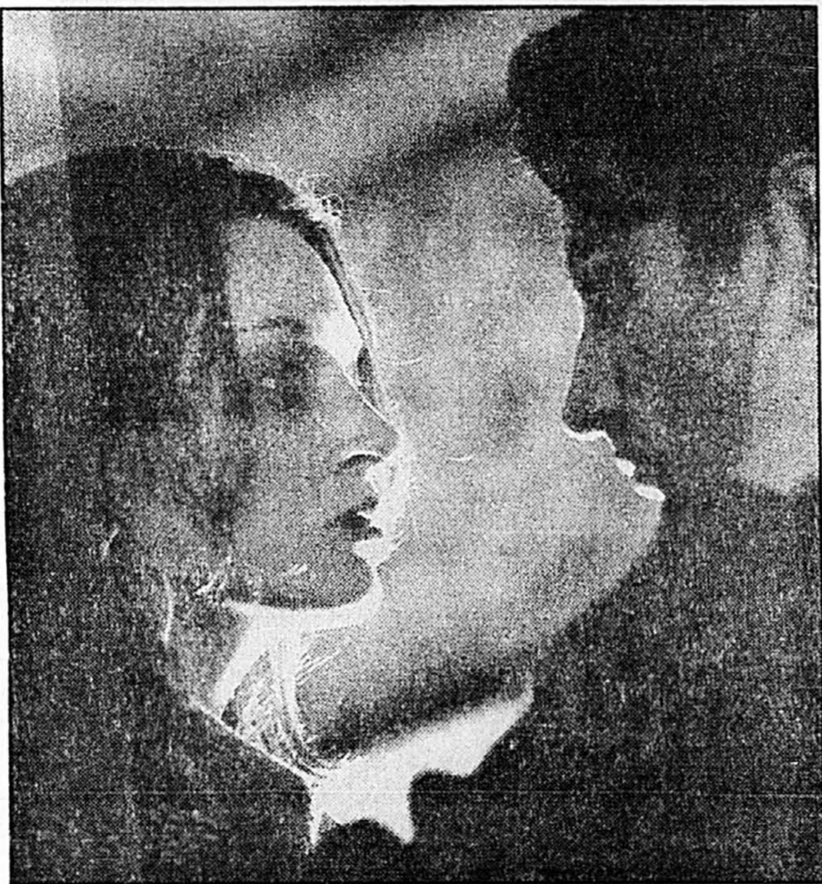
Le sergent John Berlin rencontre Helena Robertson, une belle jeune fille aveugle, seule susceptible de le conduire à un meurtrier psychopathe.

JENNIFER EIGHT , de Bruce Robinson, aux cinémas Loews 3, Dorval 2, Laval 5 et Greenfield 2.