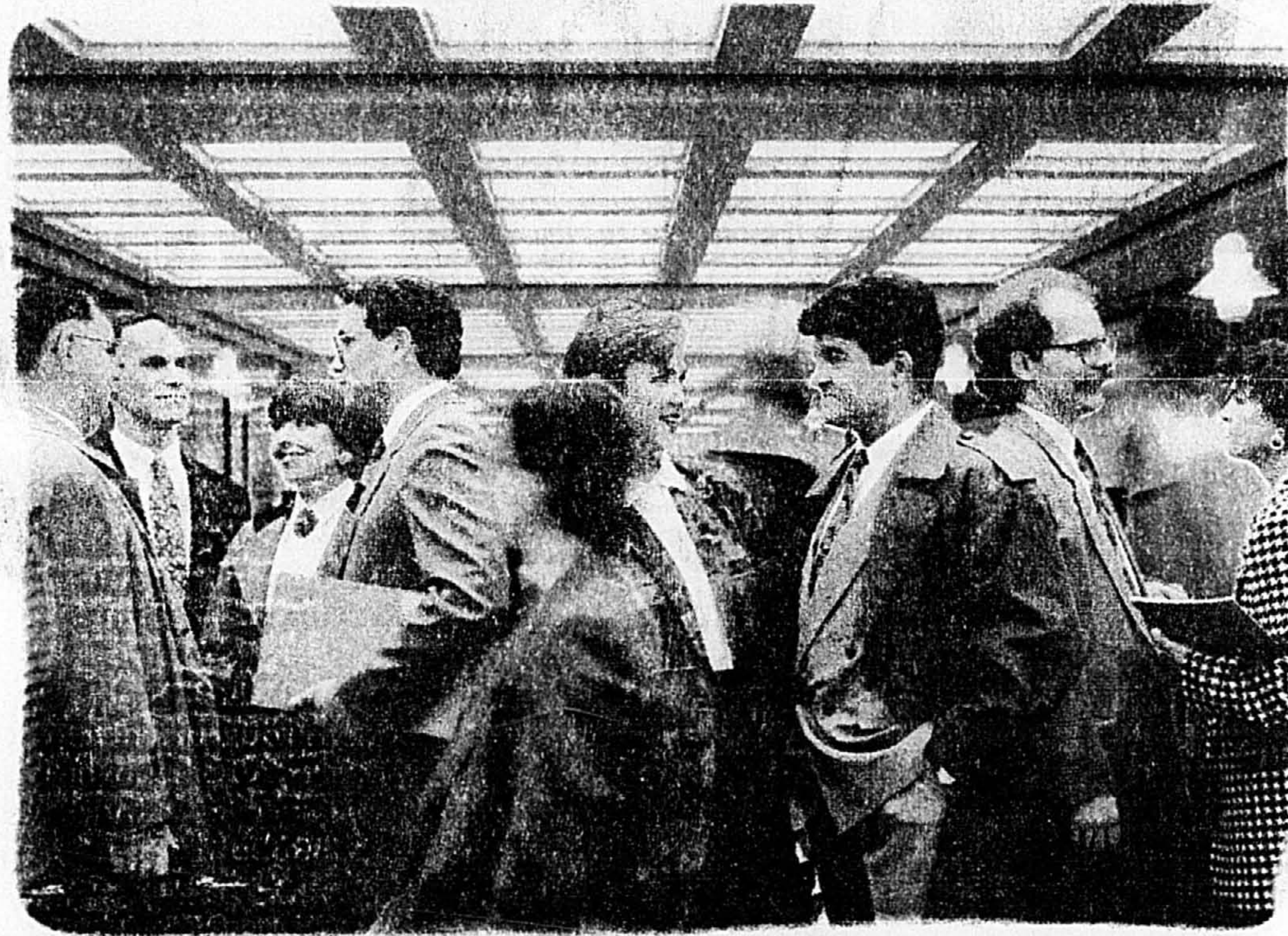
Les commissaires de la CIDEM

2137, rue Crescent, Montréal - (514) 286-9320