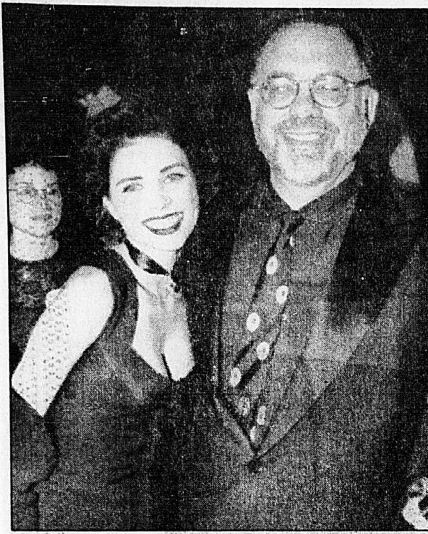
Francis Coppola, réalisateur de Dracula , et Sadié Frost qui incarne Lucy, la première victime de Dracula, ont assisté à la première du film à Hollywood.