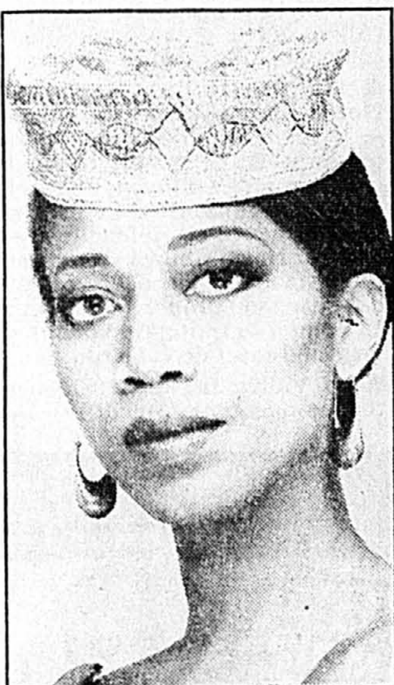
Attalah Shabazz, fille aînée de Malcolm X.

Sa mère l'interrompt: « Tous les moyens, ça voulait dire les moyens politiques, économiques; il parlait de la liberté qu'apporte une meilleure instruction et des études plus poussées. Mais les es-