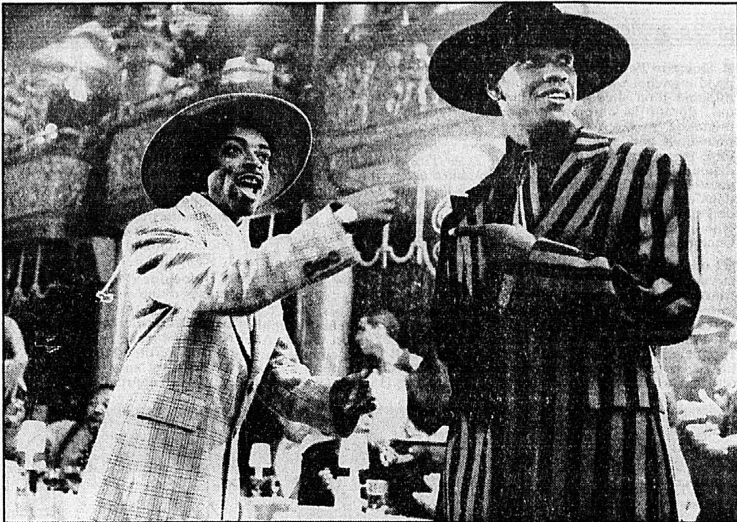
Shorty (Spike Lee) et Malcolm X (Denzel Washington) ont revêtu la tenue digne d'une tournée des grands ducs, au cours des années 40, dans la ville de Boston.