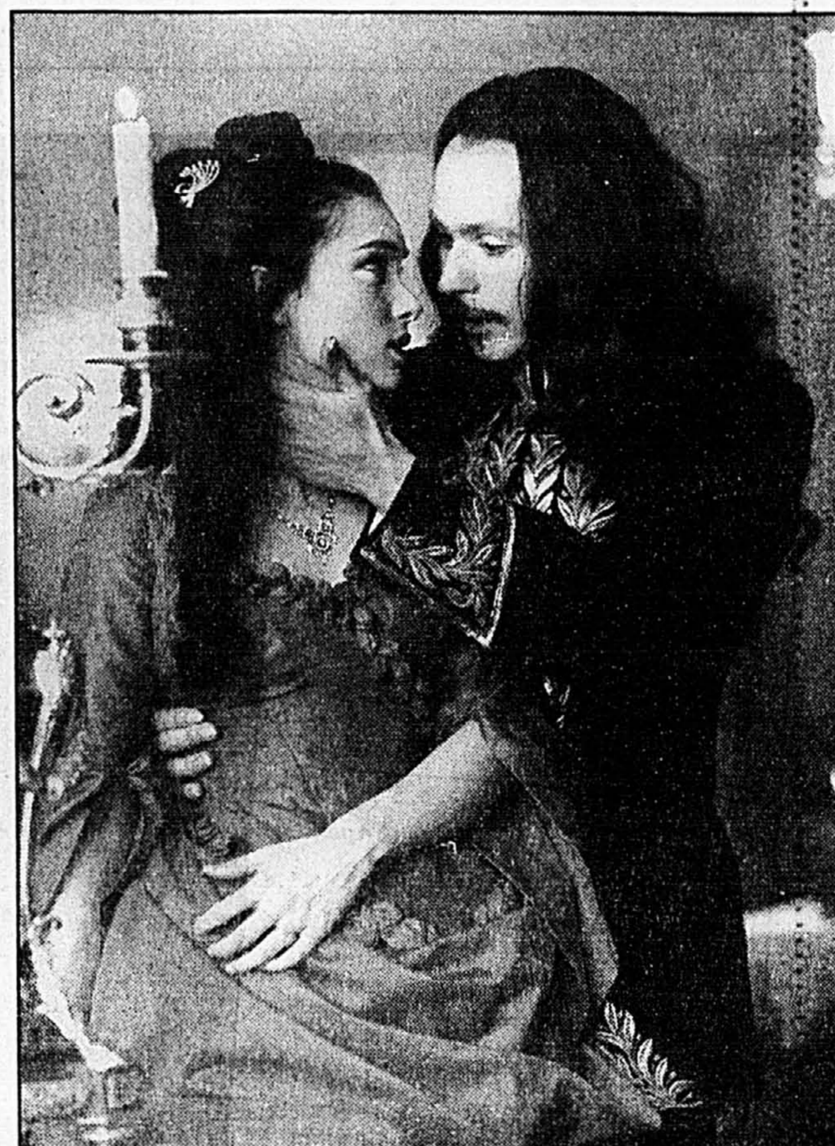
Dracula (Gary Oldman) paraît parfois guindé, même en séduisant Mina (Winona Ryder).

DRACULA , de Francis Ford Coppola, aux cinémas Alexis-Nihon 2, Égyptien 1, Pointe-Clair 1 et 2, Plaza Côte-des-Neiges 5, Carrefour Laval 6, Dorval 1 et Astre 1.