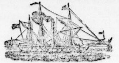
LIGNE DE MONTRÉAL. ARRIVÉE DE L'ARABIA.