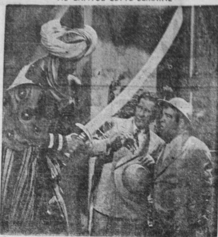
Dud Abbot et Lou Costello, vedettes du film "Lost in a Harem" que le cinéma Capitol met à l'affiche cette semaine.