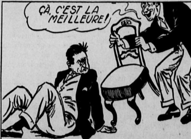
ou l'autre encore qui se croit bien fin en retirant la chaise où tu allais t'asseoir. —