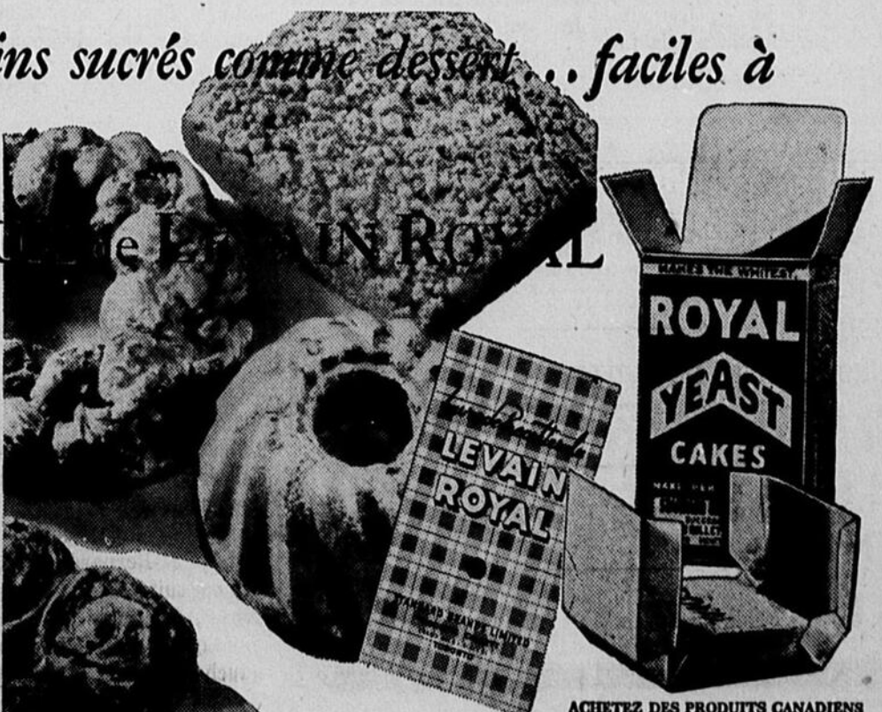
ACHETEZ DES PRODUITS CANADIENS

GRATIS! Le Livre Culinnaire du Levain Royal, contenant 23 recettes éprouvées de pains, petits pains, brioches, gâteaux, etc. Ecrivez à Standard Brands Ltd., Fraser Ave. & Liberty St., Toronto, Ont. Demandez aussi la brochure "Le Chemin Royal vers la Santé".