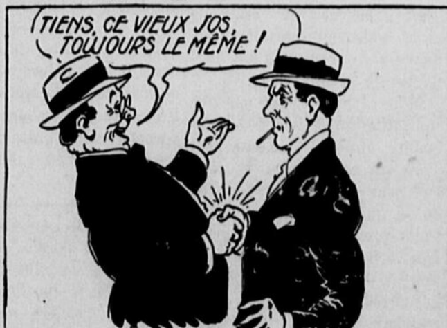
T'a pas déjà rencontré l'ami qui te paralyse la main en la serrant de toutes ses forces. —