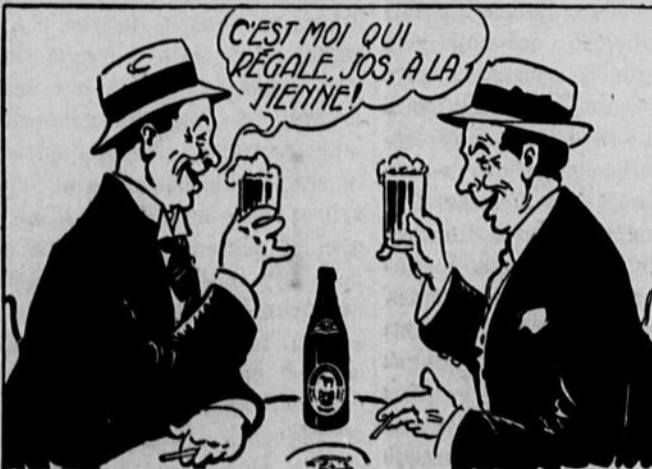
T'a pas alors rencontré un vrai ami pour t'offrir une couple de bouteilles de BLACK HORSE ?