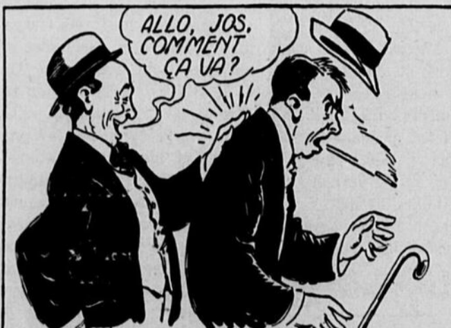
ou l'autre qui t'ébranle d'une tape amicale dans le dos pour te faire une bonne surprise. —